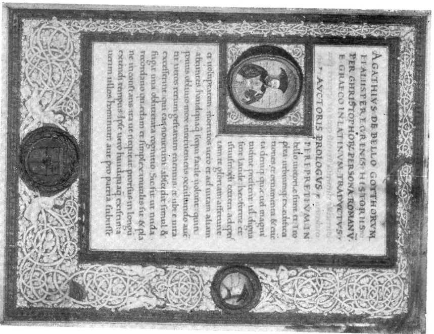
3. ábra. Mátyás király példány. München. Staatsbibliothek. Cod. Lat. 294. Fol. 2.