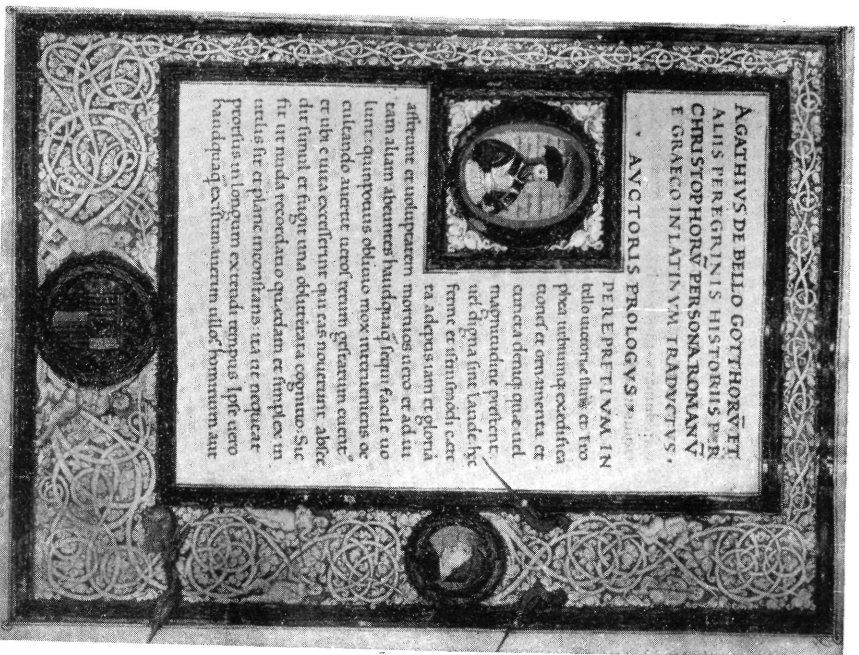
4. ábra. Ferdinand nápolyi király példány. Berlin. Preussische Staatsbibliothek. Ms. Lat. Pol. 52. Fol. 2.