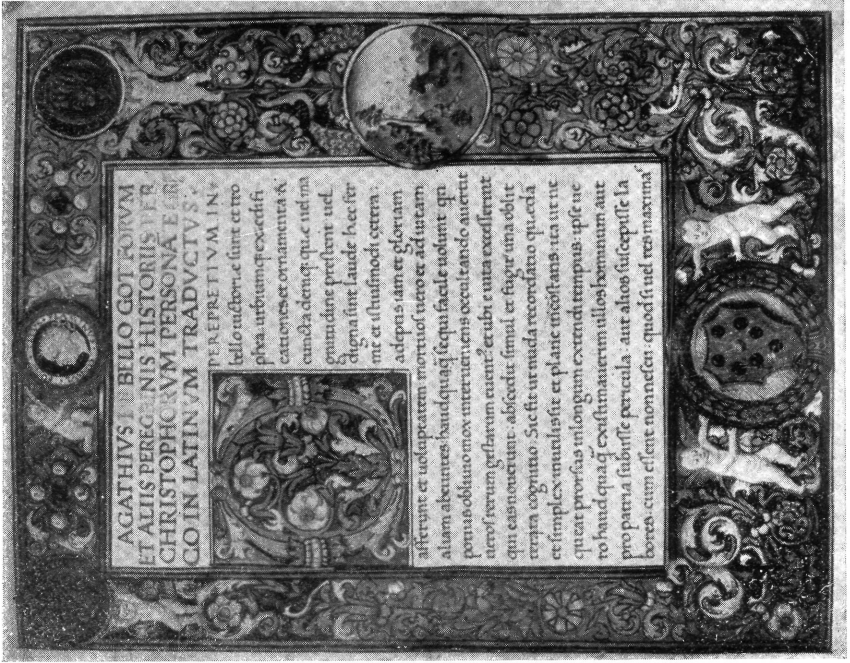
2. ábra. Lorenzo Medici példánya. Firenze. Laurenziana. Plut. 68. 23. Fol. 2.