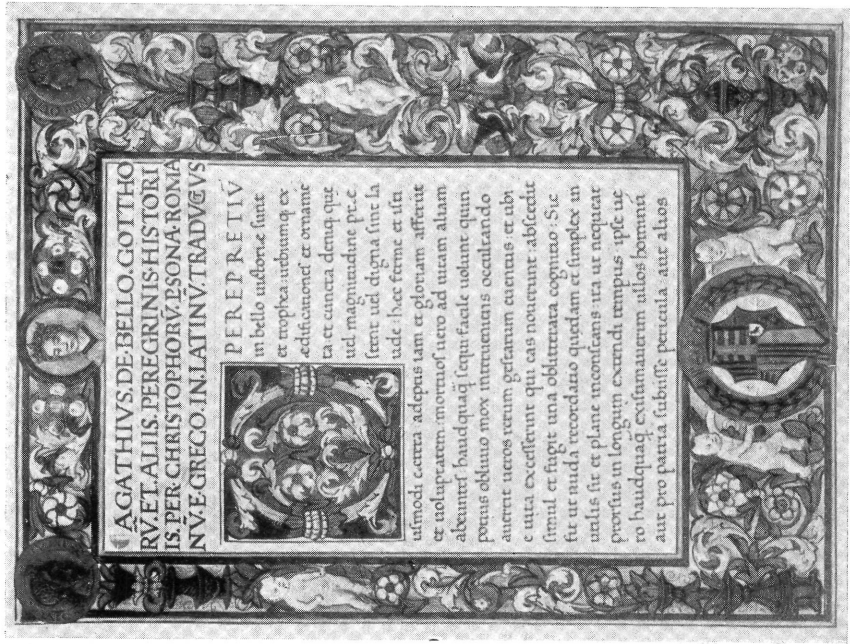
1. ábra. Beatrix királyné példánya. Bécs. Nationalbibliothek. Cod. lat. 82. Fol. 2.