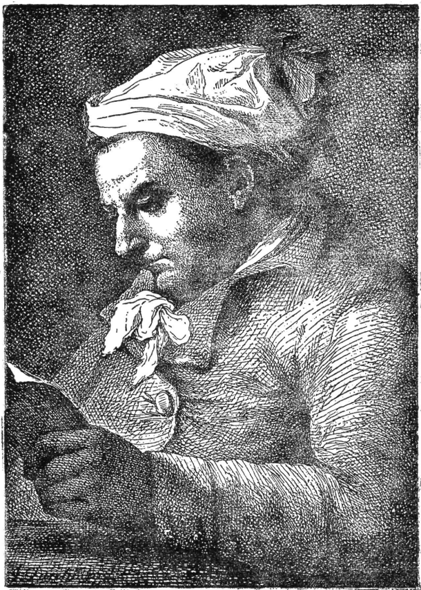
1. kép. BODONI arcképe.

Atyai nagyapja — ugyancsak nyomdász — feleségül vette egyedüli leányát annak a Niccolo VALLAURINAK, aki 1669-ben újból meghonosította Saluzzóban a nyomdai tevékenységet. Ekkor ugyanis