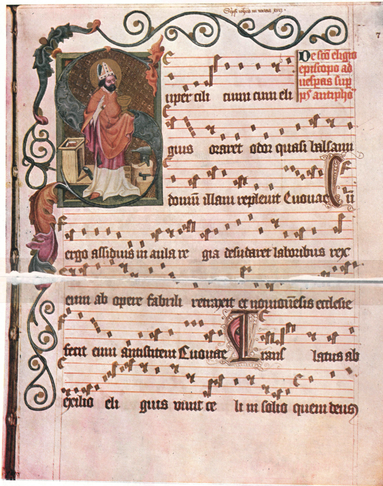
Az ötös czéli Váczott 1423-ban irt szerkönyvének egyik lapja.