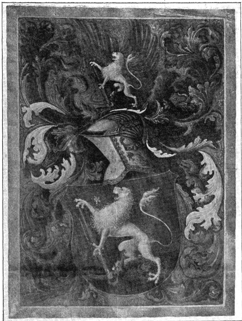
3. ábra. Armbruster Jakabnak II. Lajos királytól 1518-ban kapott czímere.