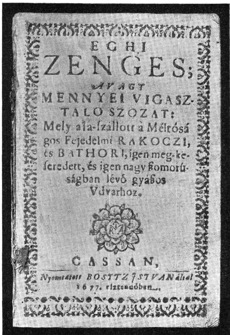
1. ábra. II. Rákóczi Ferencz fejedelem atyjának végtisztességekor elmondott beszédek czímlapja (Kassa, 1677.)