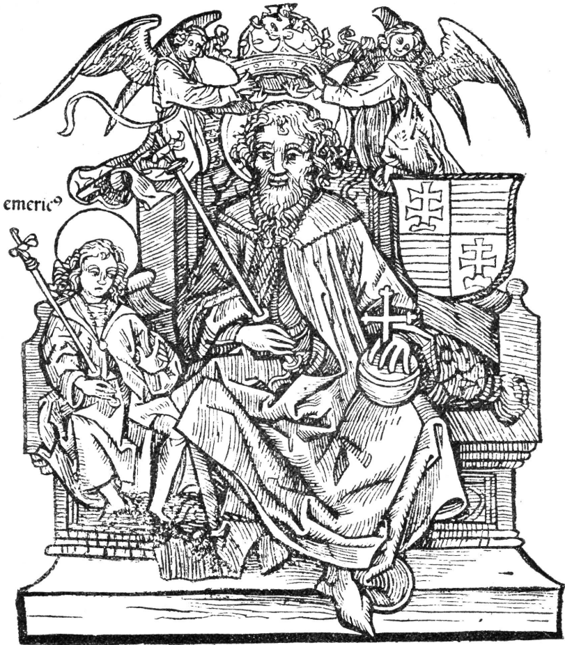
SZ. ISTVÁN KÉPE A TÚRÓCZI-KRÓNKA AUGSBURGI KIADÁSÁBAN.

A czimeres-lap, Sz. László legendája és a kis csataképek nem képezhetik összehasonlítás tárgyát; ezek kétségtelenül önálló dolgai a Ratdolt-féle kiadásnak. Bizonyosan ilyen kettő a király-