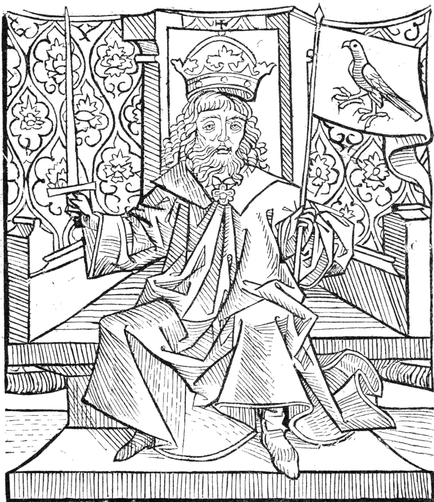
ATILLA A TÜRÓCZI-KRÓNKA AUGSBURGI KIADÁSÁBÓL.

tört kötött alakja oldalára s vezéri pálczát adott kezébe. Ismét konstatálnunk kell, hogy a brünni kép nem lehet másolat; újból hihetetlen, hogy a másoló lerajzolja a hajkőtelet s az öv mellé