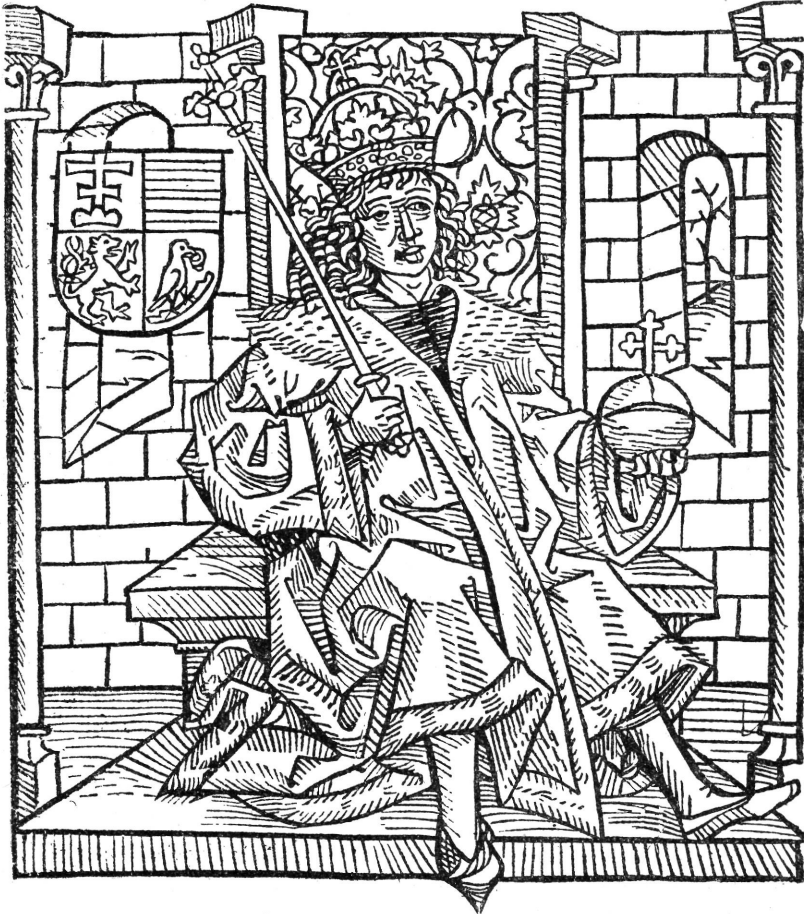
MÁTYÁS KIRÁLY KÉPE A TÜRÓCZI-KRÓNIKA AUGSBURGI KIADÁSÁBAN.

áll az augsburginak; itt is, mint a második kiadás legtöbb ábrájánál a másoló »elrajzolja« alakja lábait; képtelen az ábrázolt személyt ülő helyzetben mutatni be, minek következtében az valami elképzelhetetlen támaszkodó állást foglal el.