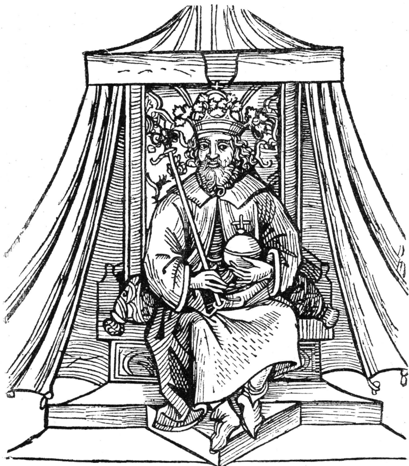
I. ENDRE A TÜRÓCZI-KRÓNIKA AUGSBURGI KIADÁSÁBÓL.

elől nyitott köntöst ad, koronáját diszesebbnek rajzolja, az egyszerű ülőpad helyett támlás trónra ülteti, a melynek a sátor mintegy menyezetét képezi. Ep utóbbi is kap egy új czifraságot,