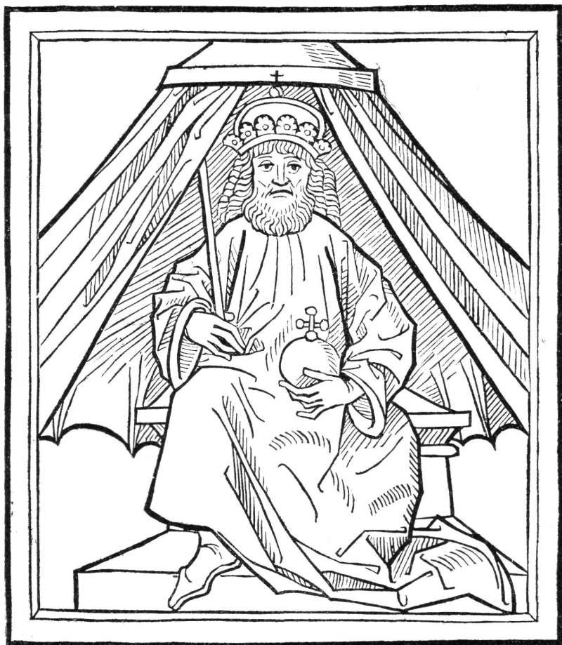
I. ENDRE A TÜRÓCZI-KRÓNIKA BRÜNNI KIADÁSÁBÓL.

Kundét ennek Árpád jában kell keresnünk; Örs képe nagyjában megfelel előképének. A királyok közül csak néhány példát hozunk fel. I. Endre a brünni krónikában sátor előtt ülve ábrázoltatik,