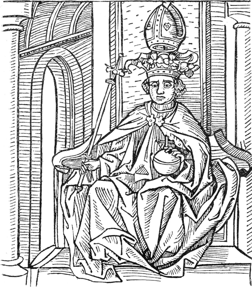
KÁLMÁN KIRÁLY KÉPE A TÚRÓCZI-KRÓNICA AUGSBURGI KIADÁSÁBAN.

Kálmán király koronázása előtt az egyházi rendbe tartozott, hanem a koszorúba nyírott hajjal, a kordával övezett csuhával s a balkezére csavart stólával is. Feltehető-e, hogy ezeket a rész-