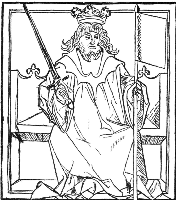
ATILLA A TÚRÓCZI-KRÓNIKA BRÜNNI KIADÁSÁBÓL.

az augsburgi lovon ülve ábrázol. A Ratdolt kiadásának többi képmásai mind a mintául szolgáló brünni képeiről vannak rajzolva. A brünni kiadás képirója nagyobb tehetséget árul el, de az augsburgi nyomdász rajzolója ügyesebb, gyakorlottabb illusztrátor; csak az ideát veszi át előzőjétől, az alak főbb körvonalait, néhol a tartást, az attributumokat, s aztán megtoldja a képeket változatos hátterekkel, czimerekkel, kevésbé fantasztikus öltözetet ad rájuk, úgy, hogy egyik-másikra alig lehet ráismerni.