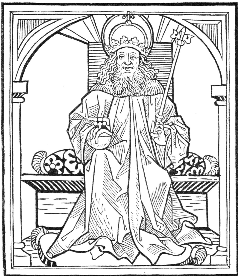
SZ. ISTVÁN KÉPE A TÚRÓCZI-KRÓNIKA BRÜNNI KIADÁSÁBAN.

előbbiekkal ellentétben a redőzet hibás, erőtlén kezelése, az árnyékoló vonalak bizonytalansága a jellemző. E csoporttal rokon vonásokat mutat Sz. István és Salamon finomabban kidolgozott