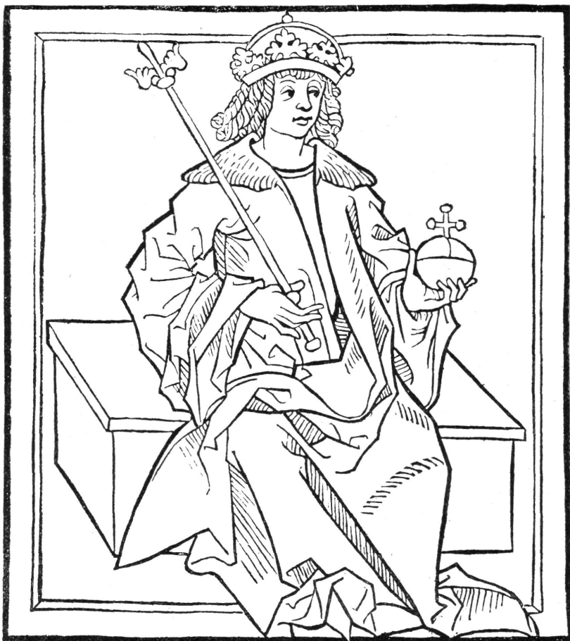
MÁTYÁS KIRÁLY KÉPE A TÜRÓCZI-KRÓNIKA BRÜNNI KIADÁSÁBAN.

Az eredeti a nagy királyt gyermekarczczal ábrázolja, megfelelően a szövegnek, a mely elmondja, minő fiatal volt Mátyás megválasztásakor. Ehhez képest az arczképet a brünni nyomdász a » De electione domini comitis Mathie in regem « című fejezet