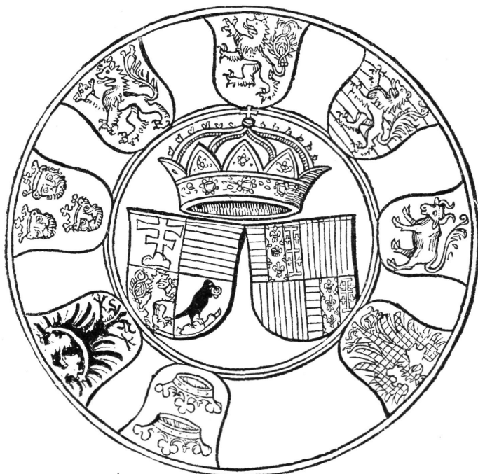
A MAGYAR BIRODALOM CZÍMERE. (A Turóczi-krónika rövidített kiadásából.)

son kell majd annak keresztül menni; az osztrák czimert kisebbre csinálta a többinél s szűkebb helyre szorította, hogy hiánya a csonka képen ne legyen olyan feltűnő.