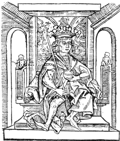
I. BÉLA KIRÁLY.