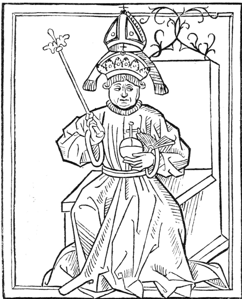
KÁLMÁN KIRÁLY KÉPE A TÚRÓCZI-KRÓNIKA BRÜNNI KIADÁSÁBAN.

gástalan, míg az augsburgi rajzoló Endréje szemetsértően hibás tartású, aránytalanul rövid alsótestű és kezei, a melyeket pedig a készítő lehetőleg hűen akart lemásolni, teljesen torzzak. Kálmán