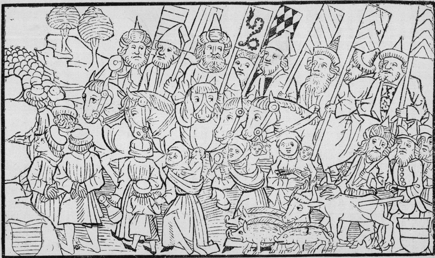
A MAGYAROK BEJÖVETELE TÚRÓCZI KRÓNIKÁJÁNAK BRÜNNI KIADÁSÁBAN.