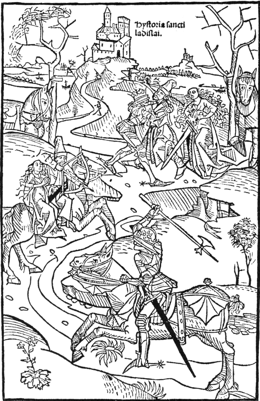
SZENT LÁSZLÓ PÁRBAJA A KÚN VITÉZZEL.

(A Turóczyi-krónika augsburgi kiadásából.)