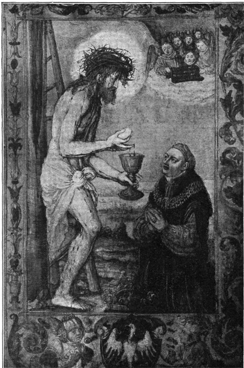
I. ZSIGMOND LENGYEL KIRÁLY ARCZKÉPE IMAKÖNYVÉBEN.