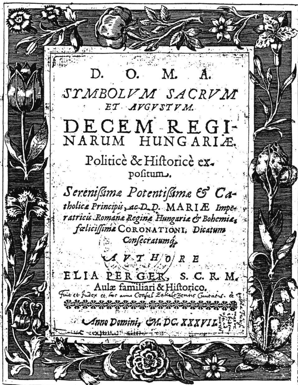
5. Berger, Elias: Symbolum Sacrum et Augustum . (Viennae) 1637. címlap