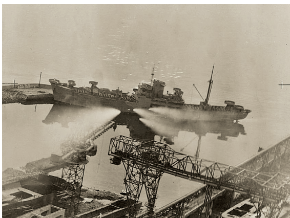
3. kép: A Kuckuck aknarakó elleni dél-afrikai légitámadás 97

1944 januárja és 1945 tavasza között a szövetséges légierő harminc alkalommal bombázta Fiumét. Ebben az időszakban mintegy 570 szövetséges repülőgép több mint 1400 tonna bombát