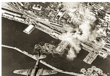
2. kép: Fiume bombázása 91