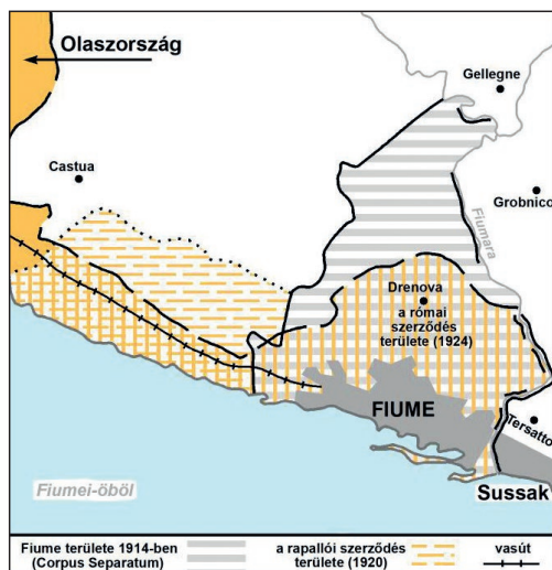
1. térkép: Fiume az 1924-es római szerződés szerint, bejelölve az 1918 előtti és az 1920-as rapallói határokat (Csákvári Kristóf)

A magyarság térvesztése olyan folyamatos tendencia, amely különösen az 1918-as hatalmváltás után, valamint a harmincas évek elején bekövetkező gazdasági válság alatt volt látványos. A háborút követően a döntően állami hivatalokban dolgozó magyarok hozzátartozóikkal együtt távoztak a zavaros viszonyok miatt egyre kevésbé élhető városból. A folyamatot nem tudta megállítani a magyar konzulátus 1921-es megszervezése sem, 15 amelynek működése a Fiume központú Carnaro tartományra korlátozódott. 16 A magyar kolónia zsugorodását kissé lassította a különböző szervezetek (Fiumei Magyar Kaszinó, Fiumei Magyar Segélyegylet) működése, valamint az 1932-ig