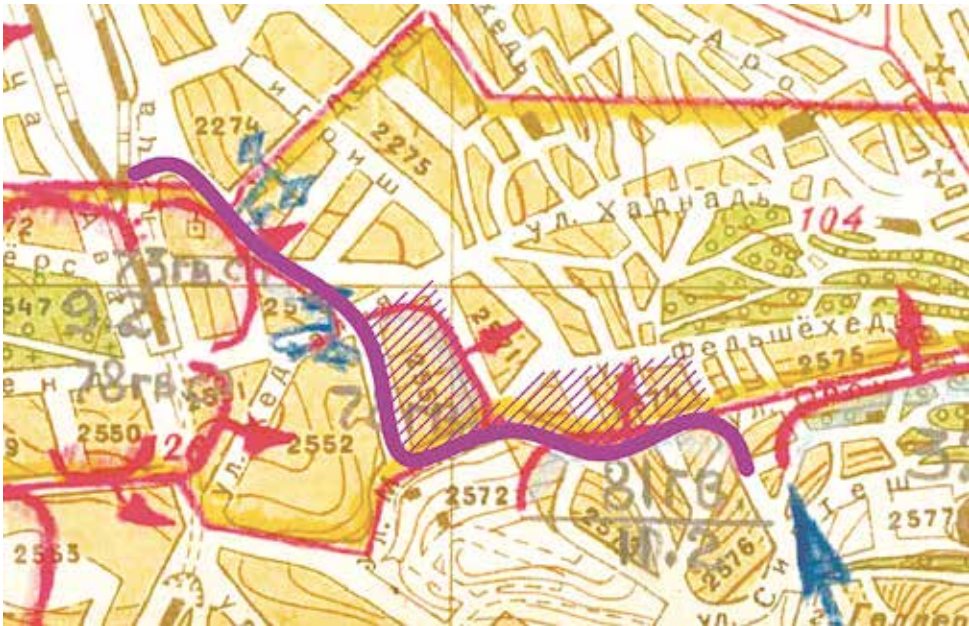
6. térkép: A 25. gárda-lövészadosztály arcvonalszakasza 72

A 25. gárda-lövészadosztály február 11-én már napok óta próbált betörni a Naphegy térségébe (majd onnan tovább a Tabán felé), ám a védők elkeseredett ellenállása, harcokcsikkal támogatott ellenlökései rendre meghiúsították a próbálkozásokat. 73