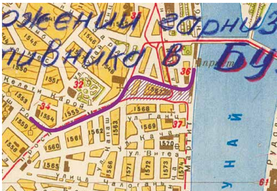
2. térkép: A 109. gárda-lövészadosztály arcvonalszakasza 19

A szovjet 109. gárda-lövészadosztály Budán északról dél felé haladva 20 jutott el arra az arcvonalszakaszra, ahol a kitörés is érte: a Dunától a Fekete Sas utcán keresztül, a Margit körút vonalán, végig a Kis Rókus utcáig. A hadosztály szempontjából legkritikusabb terület egyértelműen a Duna–Margit körút–Bem József utca által