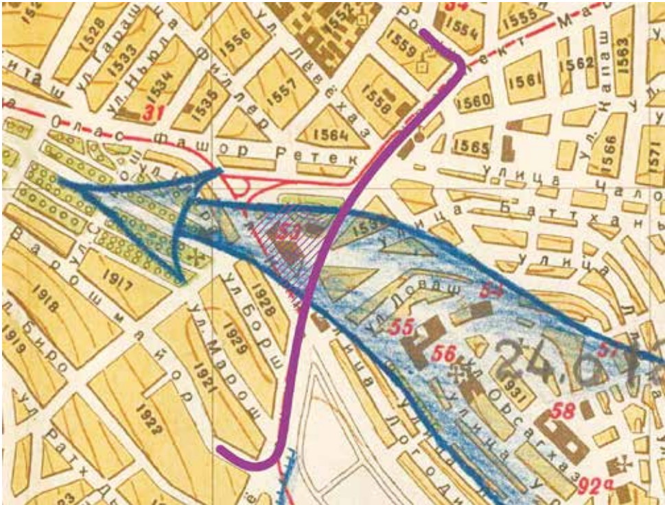
3. térkép: A 180. lövészhadosztály arcvonalszakasza 34

„A 180. lövészhadosztály törzsének 029. számú hadművelleti összefoglaló jelentése – 1945. február 11. 20:00 (Budapest térképvázlat, 1140. háztömb 35 )