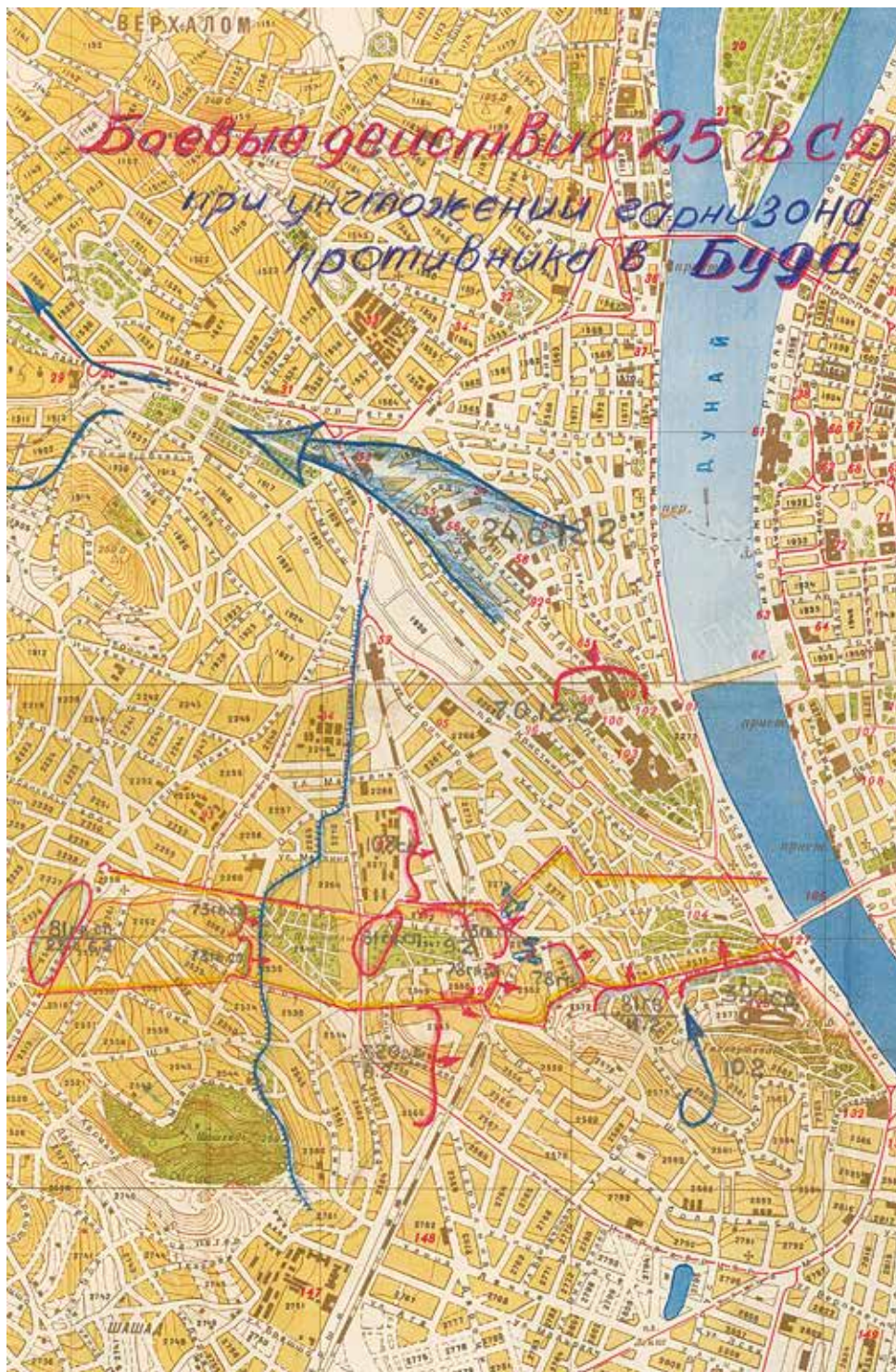
1. térkép: A 25. gárda-lövészadosztály hadinaplójához mellékelt térkép vonatkozó részlete