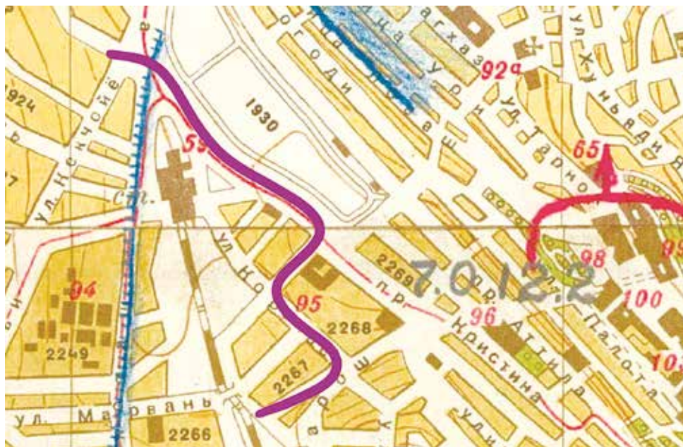
4. térkép: A 297. lövészhadosztály arcvonalszakasza 47