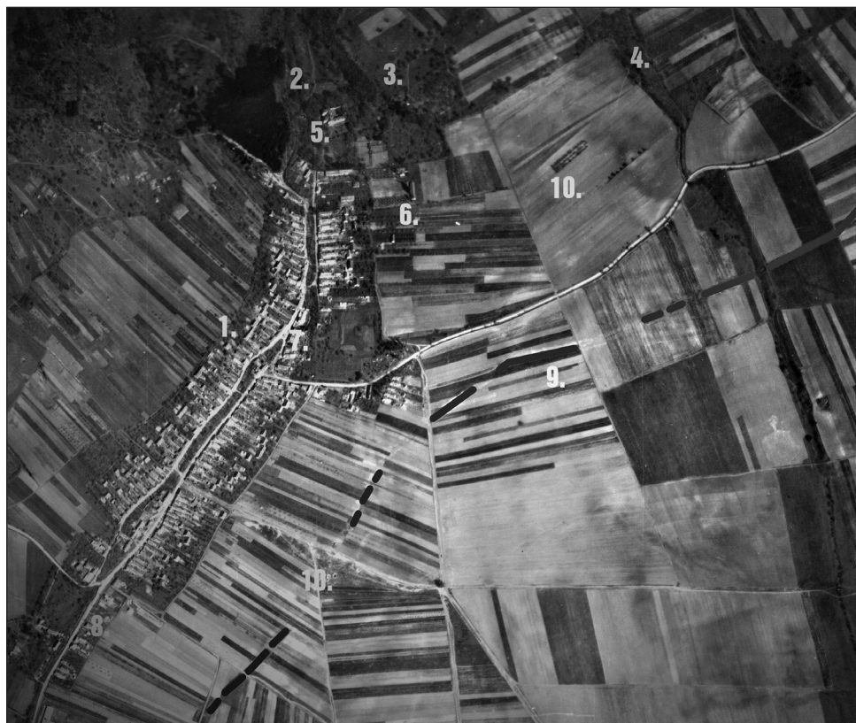
1. kép: Második világháborús erődítési munkálatok nyomai Bozsok térségében egy 1958-ban készült légi fotón

1. Bozsok település, 2. Bozsok-patak, 3. Holt-hegy, 4. Gula-völgy, 5. Sibrik-kastély, 6. Pajta, 7. Szent Anna-templom, 8. Szent József-kápolna, 9. Második világháborús erődítések (harckocsi-árkok), 10. Munkaszolgálatosok és kényszermunkára elhurcoltak temetési helyei (1944–1945).