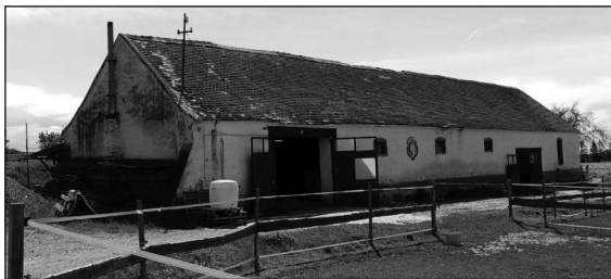
3. kép: A bozsoki erődítéseket végző munkaszolgálatosok és kényszermunkások egyik szálláshelyéül szolgáló pajtaépület napjainkban (Bozsok, Rákóczi utca 3.)

A pajtaépülethez közel levő – mezőgazdasági földek által körülvett – gyümölcsösnél a Hadtörténeti Múzeum kezdeményezett hitelesítő fémkereső műszeres terepbejárást a 2020. év nyarán. 14 A kutatómunka ekkor mintegy 2500 m 2 -es nagyságú földterületre terjedt ki.