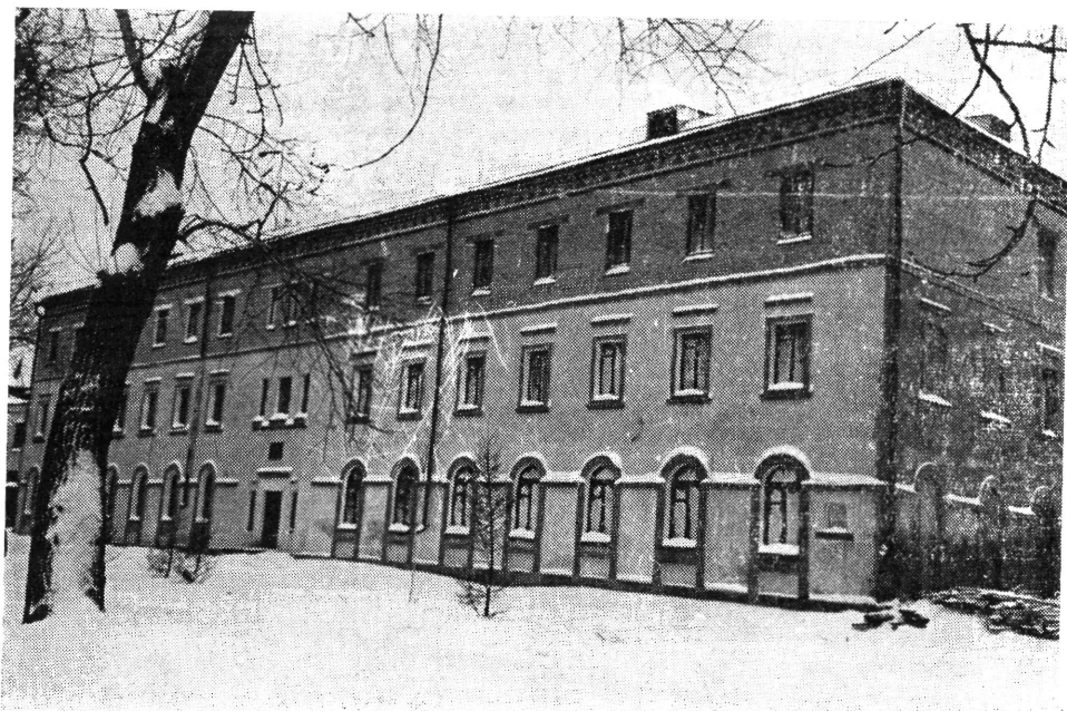
Ebben az épületben működött 1918 első felében a Tomszki Munkás- és Katonaküldöttek Szovjetjének kebelén belül megalakult Hadifogolyküldöttek Tanácsa

GATO f. 16., op. 2., d. 29a., 1. 159. (Másolat.)