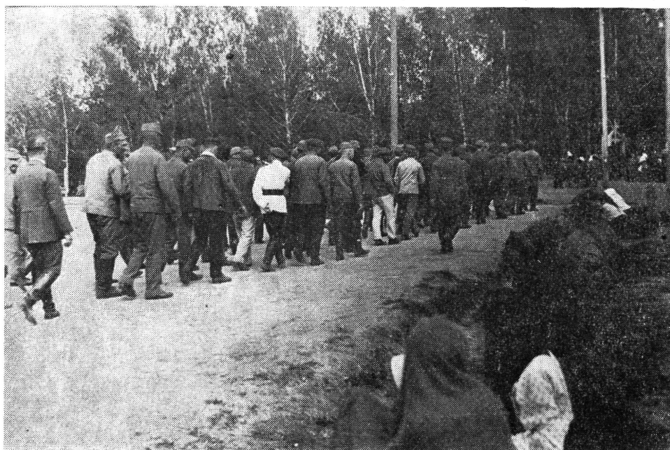
A tomszki internacionalista hadifoglyok Friedrich Adler halálos ítélete elleni tüntetésre vonulnak 1917. májusában