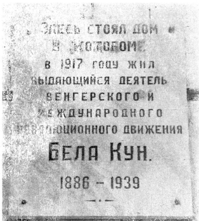
A tomszki Kirov u. 22. sz. házon elhelyezett emléktábla: „Itt állott az a ház, amelyben Kun Béla, a magyar és a nemzetközi forradalmi mozgalom kiváló vezetője 1917-ben élt”

Goszudársztvennij Arhiv Tomszkoj Oblasztyi (Tomszki Területi Állami Levéltár, a továbbiakban — GATO) f. 416., op. 2., d. 23., l. 117.