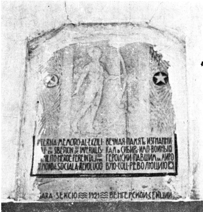
Az OK(b)P tomszki magyar szekciója által a Hadifogolyküldöttek Tanácsa egykori épületének falán 1921-ben elhelyezett emléktábla

Znamja revoljucii, 1918. május 10., 89. szám.