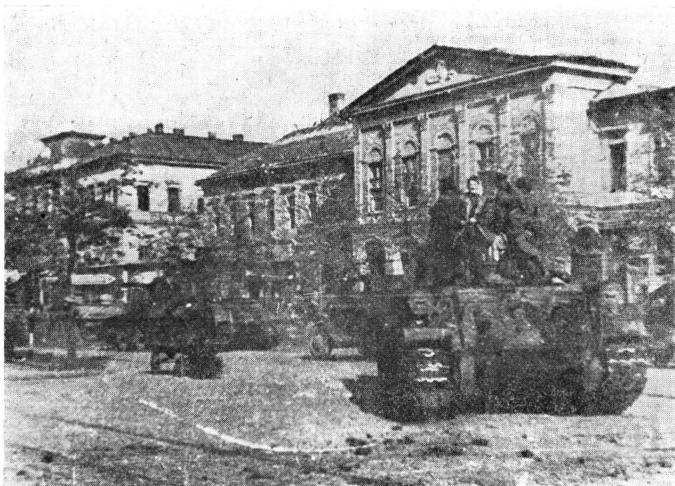
A 2. Ukrán Front csapatai Debrecenben, 1944. októberében

ellenséggel vívott harcokban több mint 140 ezer szovjet katona és tiszt esett el. 18 „Bárhol is járunk Magyarországon — mondja Kádár János elvtárs — mindenhol láthatók sírok... Ezekben azok a hősök, szovjet katonák nyugszanak, akik életüket áldozták népünk szabadságáért. Emléküket megőrizzük és ígérjük, hogy sirjaikon sohasem hervadnak el az emlékezés virágai.” 19