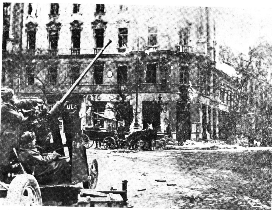
1945. február 1. Szovjet légvédelmi tüzérség az Üllői út és a Ferenc körút sarkán

A Várhegy döntő rohamának napjaiban a 83. tengerész gyalogdandár, amely az Imre-herceg útja mentén északról támadott, két önkéntes magyar századot kapott megerősítésül. A dandárparancsnok parancsot adott az egységek parancsnokainak, hogy a magyar alegységeket „vegyék teljes ellátmányba, bánjanak velük úgy, mint egyenlőkkel, akadályozzanak meg bármilyen durvaságot vagy incidenst.” 69 Egyidejűleg megmagyarázták, hogy a magyar hadifogoly tisztet és katonákat — akik önként kívánnak harcolni a fasiszták ellen — fel kell szerelni és a tevékenykedő magyar századokhoz kell irányítani. A 18. gárda-lövészhadtest parancsnokának szóló harcjelentésekben közölték, hogy a magyar századok aktívan vettek részt a 83. tengerész gyalogdandár számára megszabott harcfeleladatok végrehajtásában, amellet bátorságot és határozottságot mutattak. 70