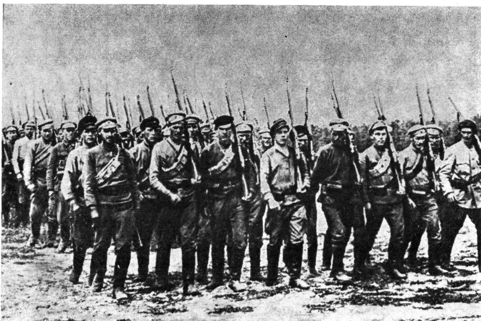
A 27. omszki lövészadosztály kiképző iskolájának növendékei a Nyugati Frontra indulnak, 1918

A szovjet hadseregnek ezt az új vonását nagyon világosan kifejezte az a dekrétum, amellyel a munkáshatalom a maga fegyveres erejét létrehozta. „A hatalomnak a dolgozók és kizsákmányolt osztályok kezébe való átmenetével — mondja a dekrétum — szükségessé vált egy olyan új hadsereg létrehozása, amely a szovjet hatalom igazi támaszául szolgál, megteremti az alapot ahhoz, hogy az állandó hadsereget a legközelebbi jövőben az egész nép felfegyverzése váltsa fel, segítséget nyújt az Európában majdan kibontakozó szocialista forradalomnak...” Az új jelleget fejezte ki a hadsereg elnevezése is, amely a dekrétum szerint „Munkás-Paraszt Vörös Hadsereg lesz”. E hadsereg feladatát még világosabban határozza meg a dekrétum amikor így fogalmaz: „A Vörös Hadseregbe beléphet mindenki, aki kész erejét, életét áldozni az októberi forradalom vívmányainak a szovjetek hatalmának és a szocializmusnak a védelmében.”