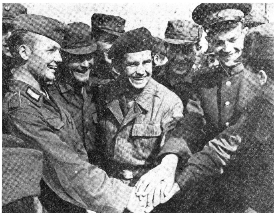
„Vltava” hadgyakorlat. Magyar, német, csehszlovák és szovjet katonák barátkozása