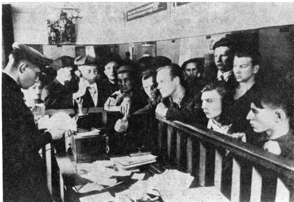
Önkéntesek jelentkezése a moszkvai Októberi Kerületi Katonai Parancsnokságon, 1941. június 22.

kormány szavát, amikor azt mondták: „... a fasiszta Németország által ránk kényszerített háborúban a szovjet állam léte forog kockán, hogy itt arról van szó, vajon szabadon élhetnek-e majd a Szovjetunió népei, vagy pedig rabszolgasorba döntenek őket.”