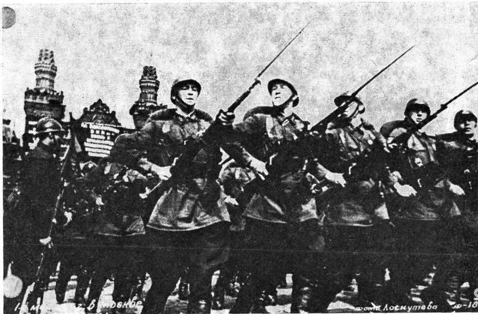
Díszszemle a Vörös téren 1936. május 1-én

Nem lazult a hadsereg és a nép kapcsolata a polgárháború befejezése után sem. Sőt, azáltal, hogy a polgárháború után közel 4 millió ember tért vissza a polgári életbe és kapcsolódott be a békés építőmunkába, ez az összefonódás csak tovább erősödött.