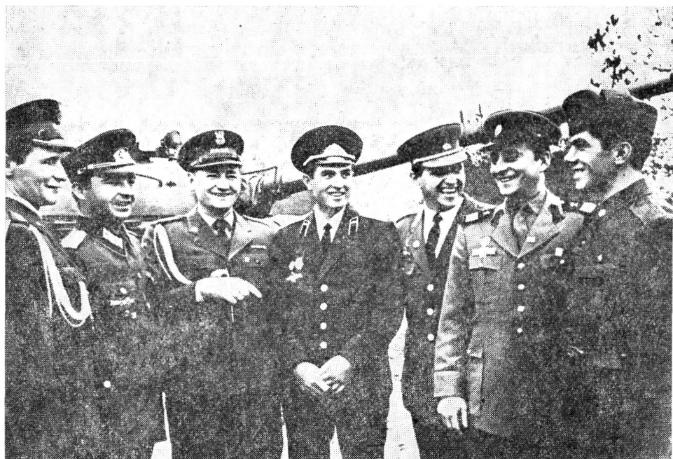
Fegyverbarátság — Varsói Szerződés