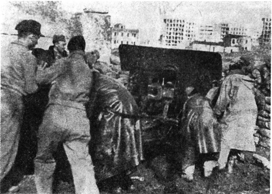
Magyar önkéntesek a madridi Egyetemi Városban

A spanyol kormány a szervezés központjául Albacete városát jelölte meg, mely Madridtól délkeletre, 280 kilométerre fekszik. Október közepére e