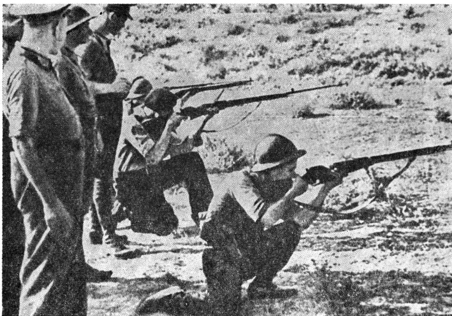
A magyar zászlóalj katonái lövészeten