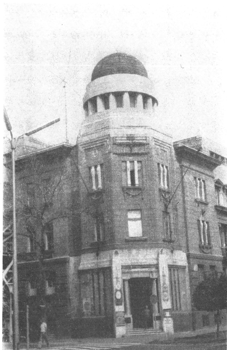
A HM debreceni székháza — 1945