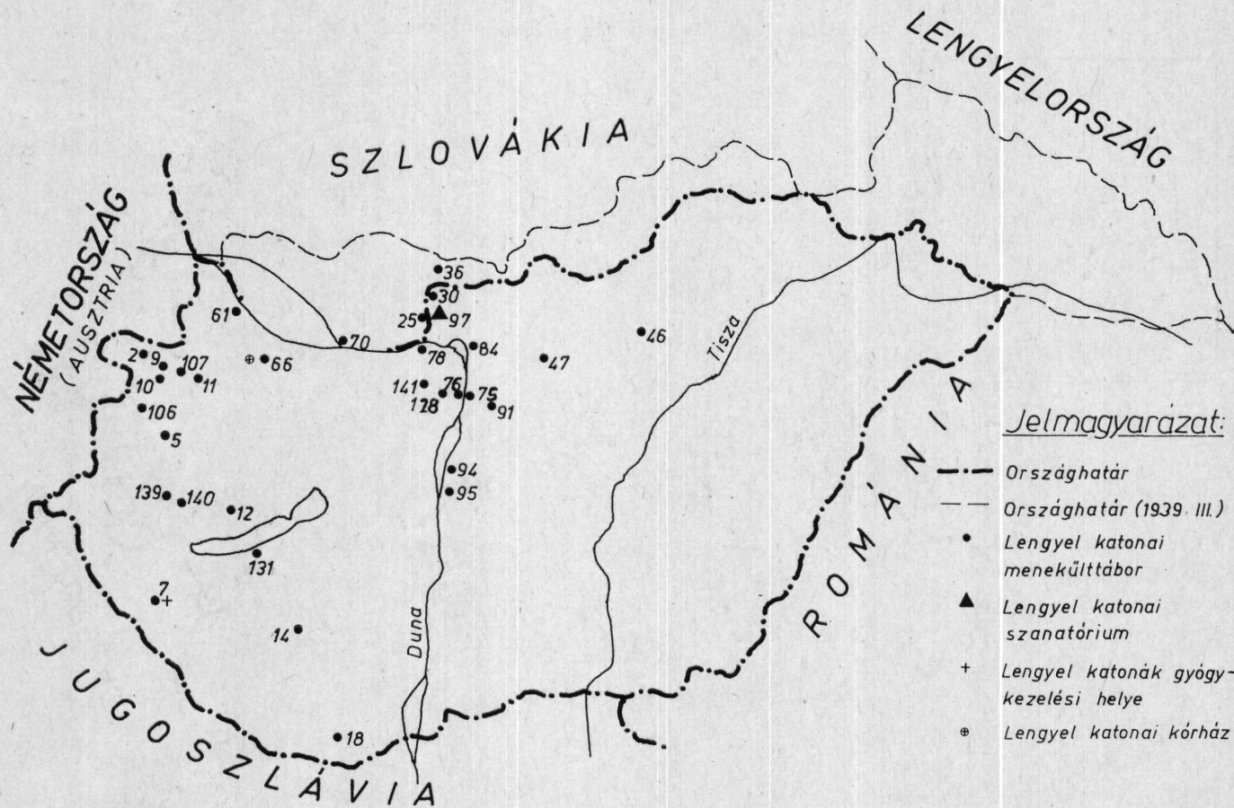
Lengyel katonai menekülttáborok és egészségügyi intézmények 1939 őszén