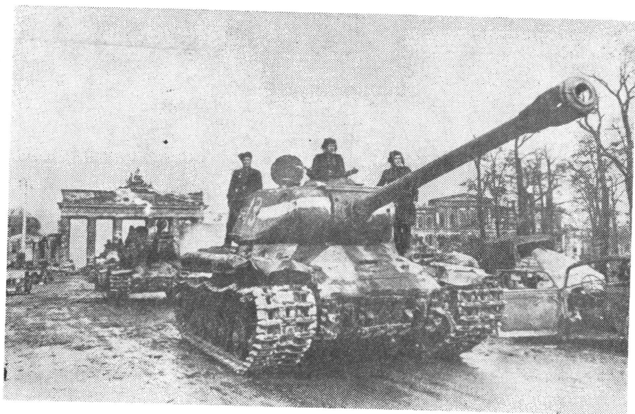
Szovjet harckocsik Berlinben. 1945