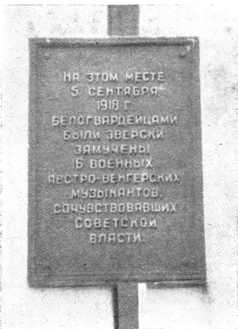
A Habarovszkban kivégzett magyar zenészek emléktáblája

Ott jártamkor e történet hősének nevét a habarovszki emberek nem tudták megállapítani. A márványtábla, mely az Amúri-Flottilla támaszpontján áll, csak úgy örökítette meg nevét, ahogy azt az orosz nép fiai a szívükbe