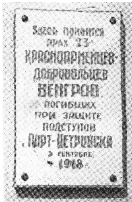
A mahacskalai magyar internacionalisták emlékművének márványtáblája

Dicsőség és tisztelet nektek, drága elvtársak! A munkások és parasztok Oroszországa hálával emlékezik meg hősiek önfeláldozástoktól. És Dagesztán lakói, majd ha visszatérnek Petrovskba, méltó emléket állítanak hősi sírotok fölé!” 7