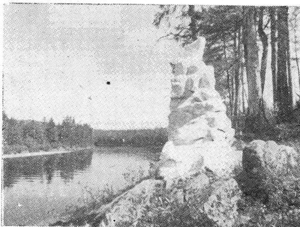
Internacionalista emlékmű a Tunger folyó partján

Majd évek múlva arról értesültem, hogy az őserdő mélyén, a Tungir folyó partján Magocsa hálás leányai és fiai emlékművet emeltek az ismeretlen hő-