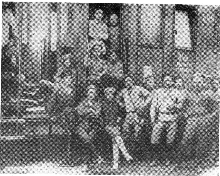
2. sz. ábra. A kazáni ezred parancsnoki kara

vedett vereség után még nem tudta rendezni sorait. A Vörös Hadsereg egységei 100 km-es meneteléssel dél felől megkerülték a Balchani hegyláncot és lecsaptak az ellenség Ajdin vasútállomáson rendeződő főerőire.