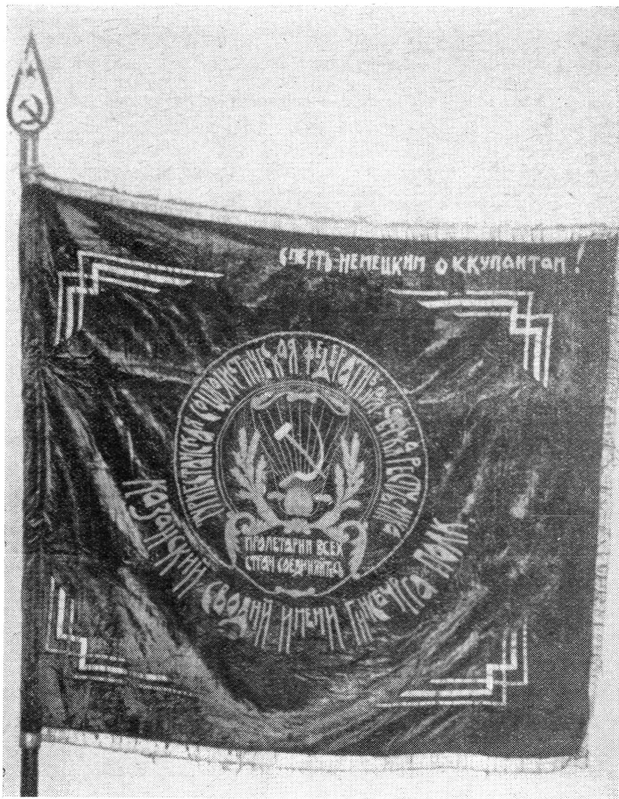
1. sz. ábra. Ginzburg nevet viselő Kazáni internacionalista ezred zászlaja