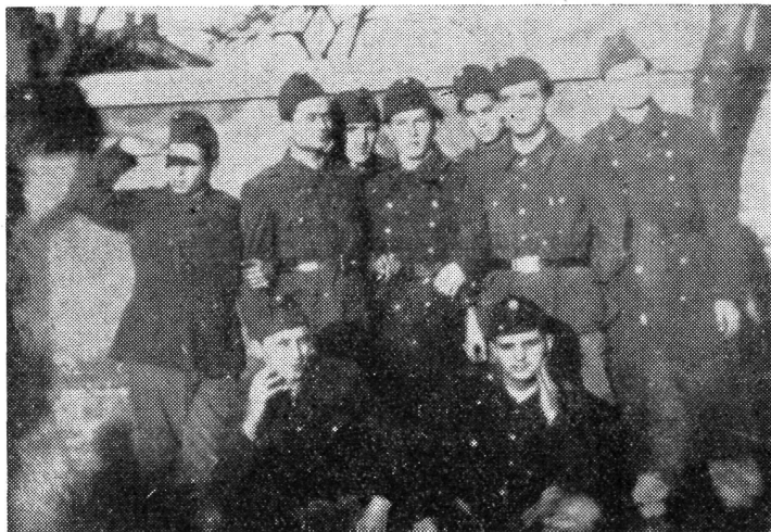
A kisegítő karhatalom honvédeinek egy csoportja

Az alakulat legöntudatosabb rétegét azok a férfiak képviselték, akik a baloldali pártok, antifasiszta szervezetek, a nyilas- és németellenes csoportok, a baráti és elvtársi kapcsolatok révén tudatosan kerültek Gidófalvyhoz. Ezek száma a későbbiekben kb. 50—60 főre rúgott. Jórészüik szökött politikai fogoly, körözött, halálra keresett egyén, a fasiszta rendszer elszánt ellensége volt. Ezek tartoztak az egység legharcosabb csoportjához. Súlyukat növelte, hogy Gidófalvy révén szinte minden jelentős beosztást, parancsnoki helyet kézbe kerítették. 34