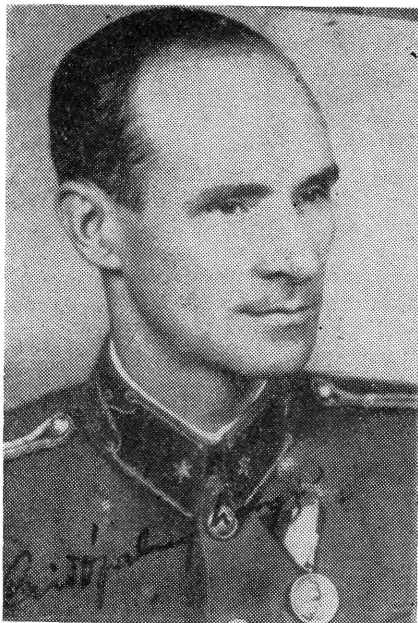
Gidófalvy Lajos őrnagy (1901—1945)

zést, és a maga részéről mindent megtett a sárga csillagosok megsegítésére. Összekötéseit felhasználva embereket hozott ki az internáló táborból, a bácskai vérengzés idején Újvidékre utazott, hogy barátait mentse. 11 Amiért egy hontalan zsidó állampolgársági ügyében közbenjárt, a hadbíróóság elé idézték és elítélték. 12 Politikai elvei ekkor sok tekintetben Bajcsy-Zsilinszky Endre koncepciójával látszottak megegyezni.