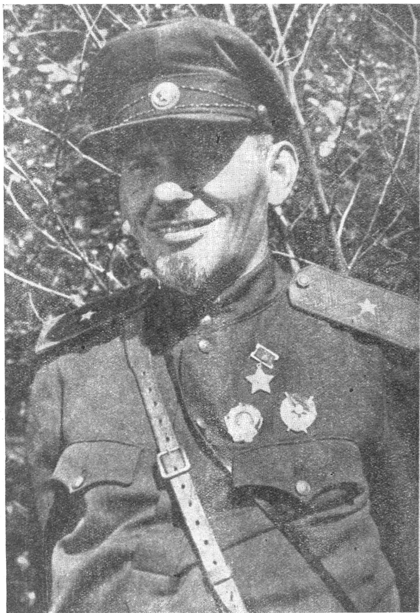
Kovpak, a legendás hírű partizántábornok