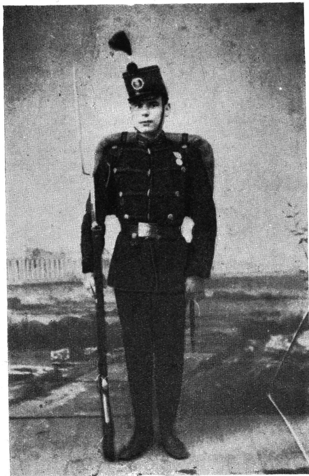
Az olaszországi magyar légió gyalogosa.