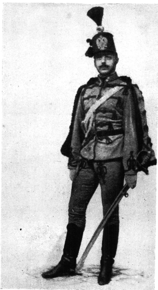
Cs. k. huszártizedes 1859. (Fénykép után).