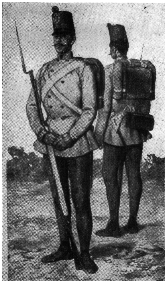
Magyar sorgyalogezredbeli közvitéz. 1850—59. (Korabeli könyomat.)