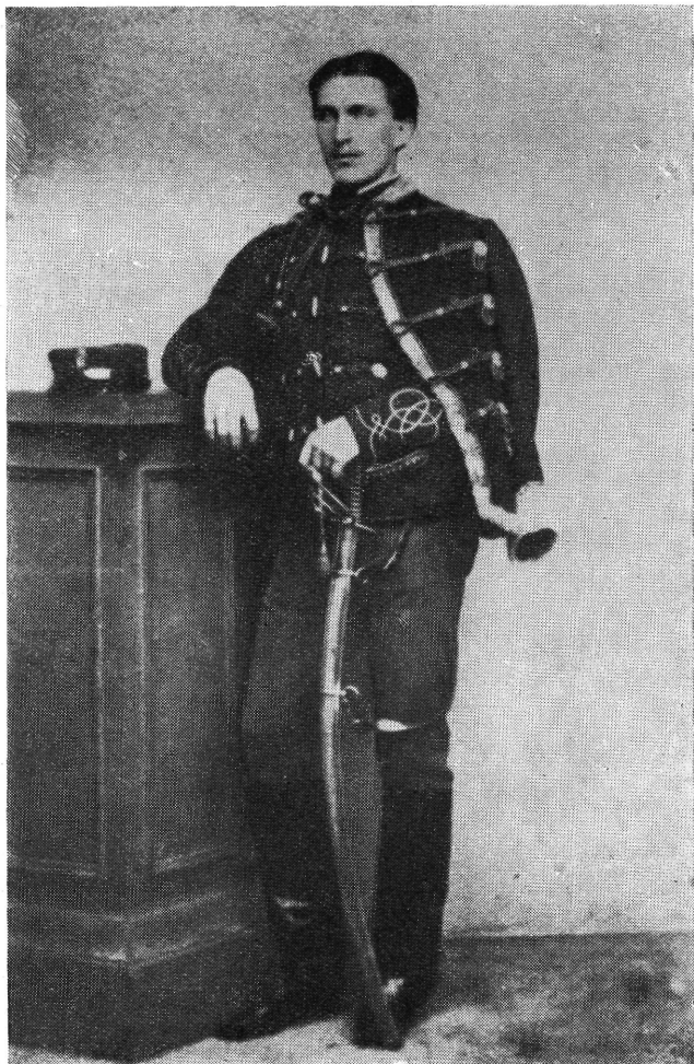
Az olaszországi magyar légió huszártisztje 1862.