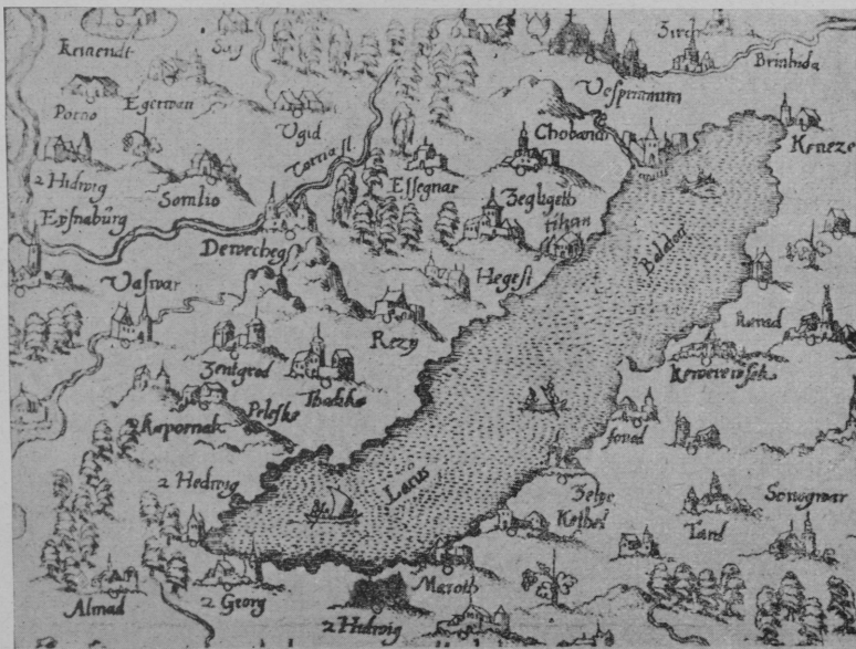
A Balaton a nagy haditérkép javított kiadásán.