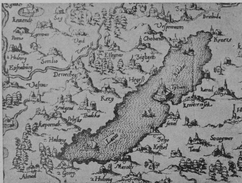
A Balaton a nagy haditérkép első kiadásán.

fellendítették az ország térképezését. A királyi hadvezetőségnek szüksége volt térképekre, amelyekről az egyes országrészek helyzetét áttekinthették és pontosan tájékozódni tudtak. 1) Ezekről a térképekről aztán messze földön is