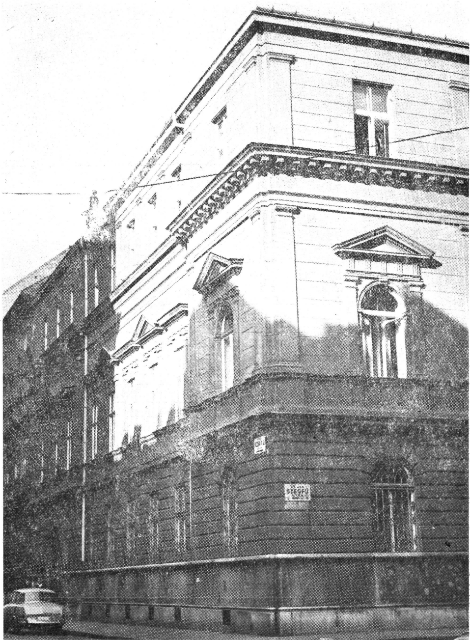
A Marx—Lenin Ház, az internacionalisták politikai szervezetének központja (Budapest V., Rózsa F. u. 61.)