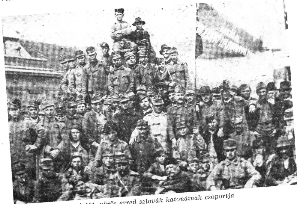
A 101. vörös ezred szlovák katonáinak csoportja

Ez a két ezred alkotta a 80. nemzetközi dandár gerincét. A felosztott 3. ezredből a „Balkán vörös zászlóaljat” egészítették ki, így a szerbek, albánok, olaszok, bolgárok, horvátok és törökök valamennyien egy zászlóaljba kerültek. Ezenkívül még két nemzetközi zászlóalj volt, amelyek közül az I/27.-ben oroszok és lengyelek, a II/26.-ban lengyelek, szerbek, oroszok, németek és románok voltak. A szlovákokat — mint erre már utaltunk — a 16. felvidéki ezredbe