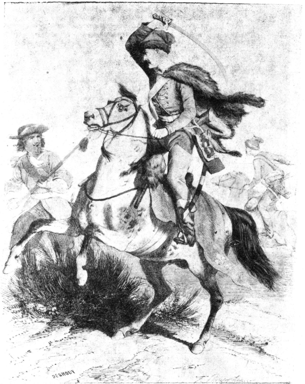
Rátky-huszár, 1712. A „Historiques des corps de troupe de l'armée française 1569—1900” című Párizsban 1900-ban megjelent mű illusztrációja