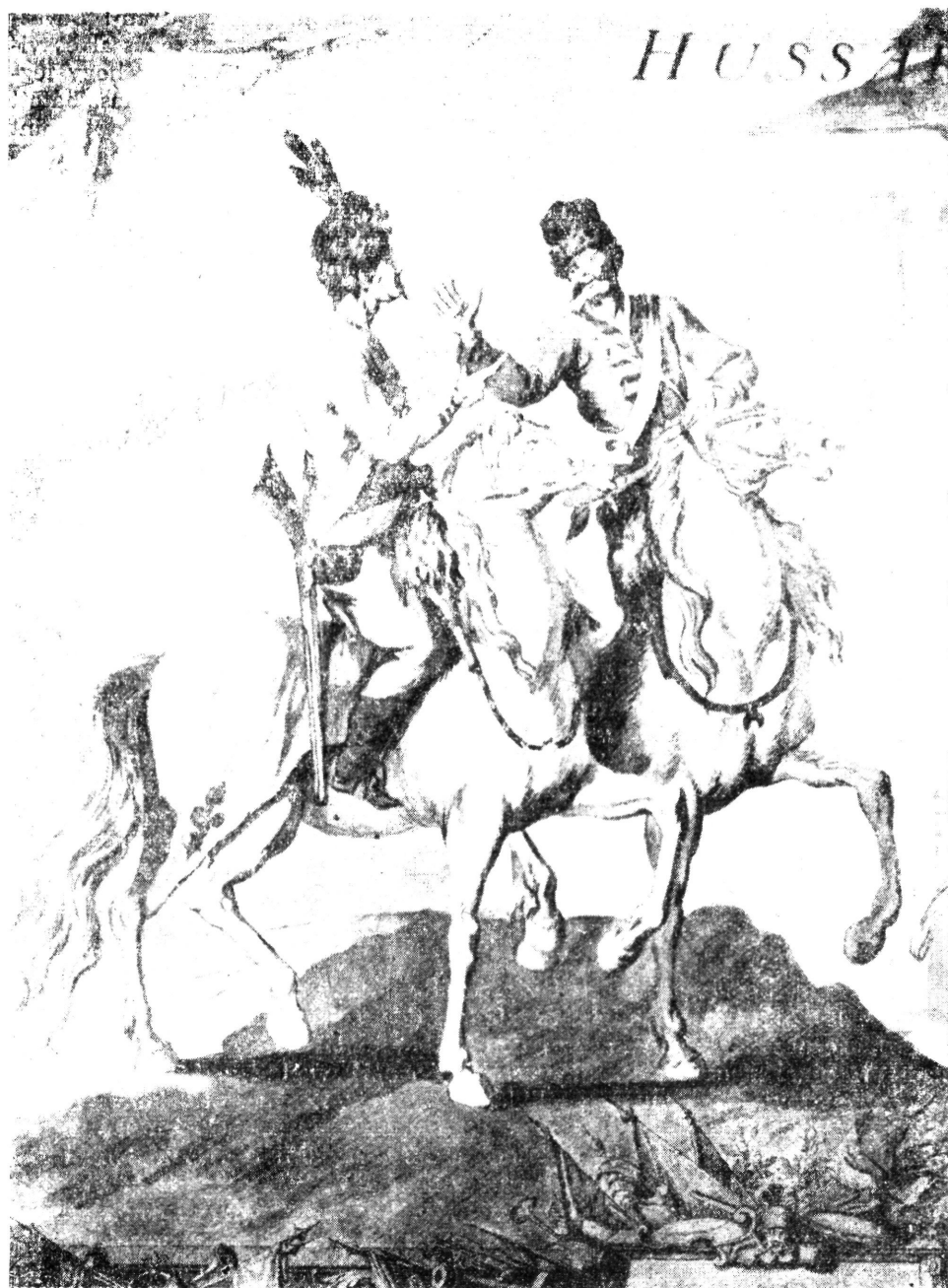
Ráttky-huszárok 1719-ben, A. Pascal 1847-es művének illusztrációja