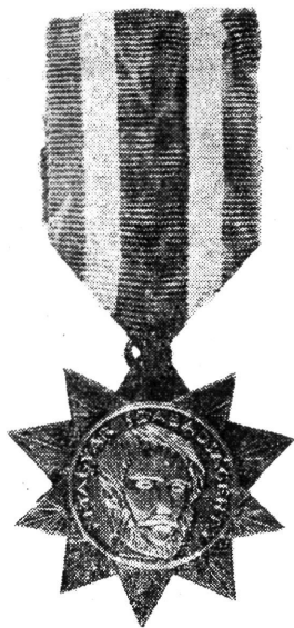
1. kép. A Magyar Szabadság Érdemrend első, ún. „Krisztusfejés” változata

Az a) változatú érdemrendről, amelyet 1946. május 10-től október 14-ig ado-