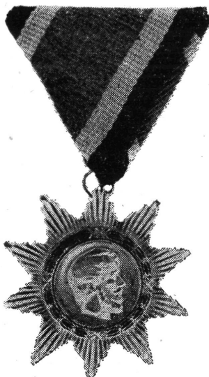
2. kép. A Magyar Szabadság Érdemrend második, ún. „Kossuth címeres” változata

1946 elején a Szövetség — érdemrend alapítására vonatkozó — előterjesztését a Magyar Kommunista Párt vezetősége elfogadta. A Szövetség vezetősége úgy tervezte, hogy 1946. május 11—12-én megrendezésre kerülő I. Országos Kongresszusán a partizánok első csoportjának a kitüntetéseket átadják. Ez az elképzelés rendkívül kifejező és impozáns megnyilvánulásnak ígérkezett, de ugyanakkor igen gyorsan végrehajtandó feladatsorozat megoldását igényelte.