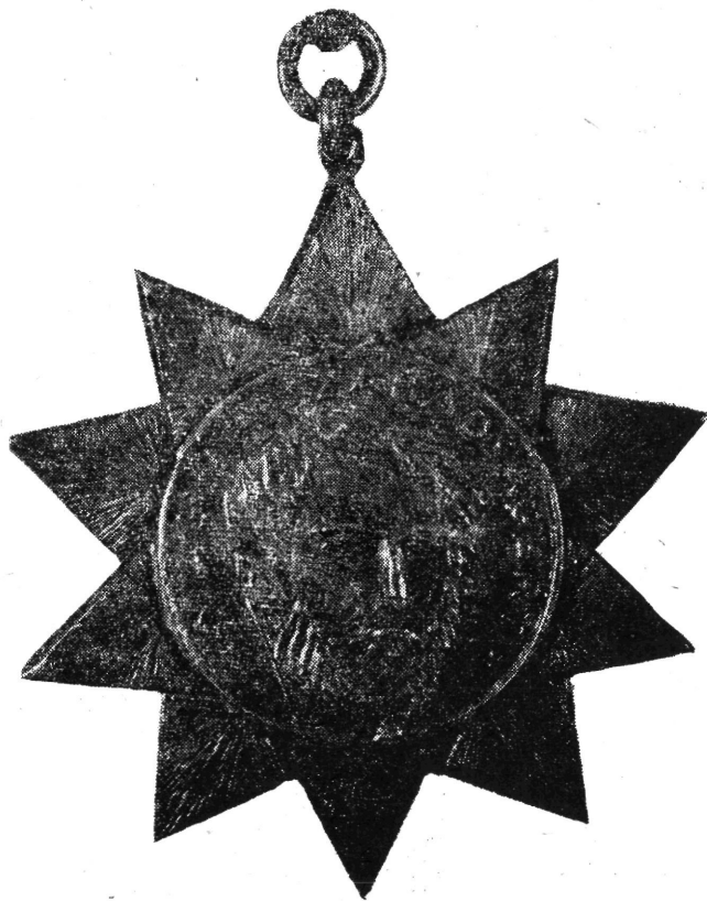
3. kép. Durván kidolgozott készítmény

Az ezüst fokozat jelvénye három, egyenként 1—1,5 mm vastagságú, egymásra forrasztott ezüstlemezből készült kompozíció. A jelvény előlapjának kiemelkedő része egy 25 mm átmérőjű lemezkorong, amelyben Kossuth félbalra néző domború képmása látható a MAGYAR SZABADSÁGÉRT körfelirattal. E mögött van egymásra forrasztva két sugárszerűen rovátkázott, 43—43 mm átmérőjű, ötágú lemezcsillag oly módon, hogy együtt a Kossuth képet övezve egy szabályos, tízágú csillagot alkotnak. A jelvény hátlapjának felső harmadában 3 mm-