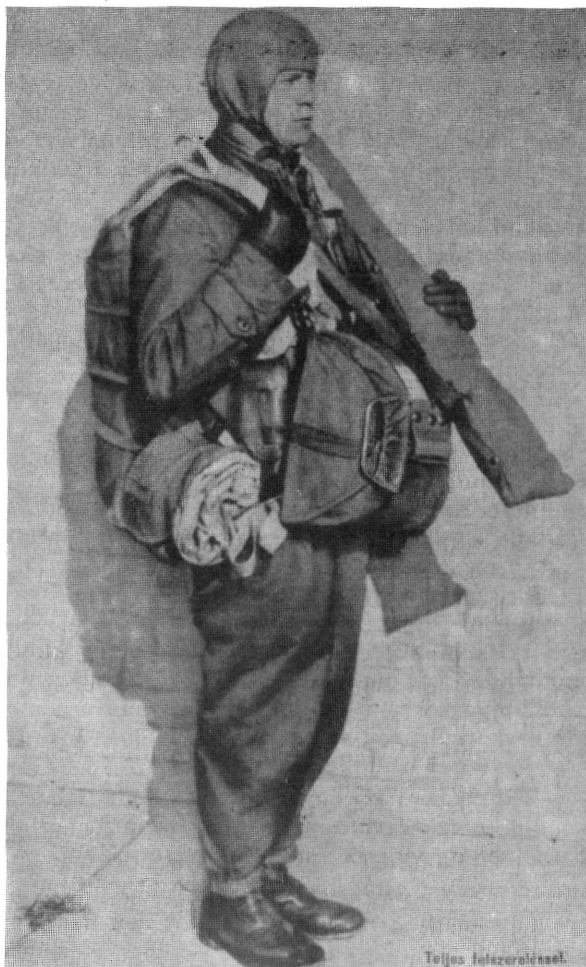
4. kép Ejtőernyős katona ugrás előtt

augusztusában váratlanul ígéretet kapott arra, hogy a polgári légiforgalom a rendelkezésre álló gépekből átad 5 darab Savoia—Marchetti SM—75 típusú gépet a magyar légierőnek. Ebből egy hamarosan meg is érkezett Szombathelyre az ejtőernyősök nagy örömeire. 41