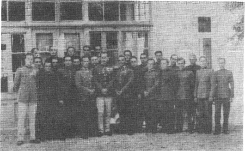
5. kép Az ejtőernyős keret Szombathelyen

Gyakorlott, ügyes embereink igen jól oldották meg ezt a kényes feladatot. Mint a szemtanúk elmondták, nagyszerű látvány volt a szinte egyszerre ki-robbanó 21 ejtőernyő, mely néhány másodperc múlva már földet is ért. Nem történt semmi baj...”