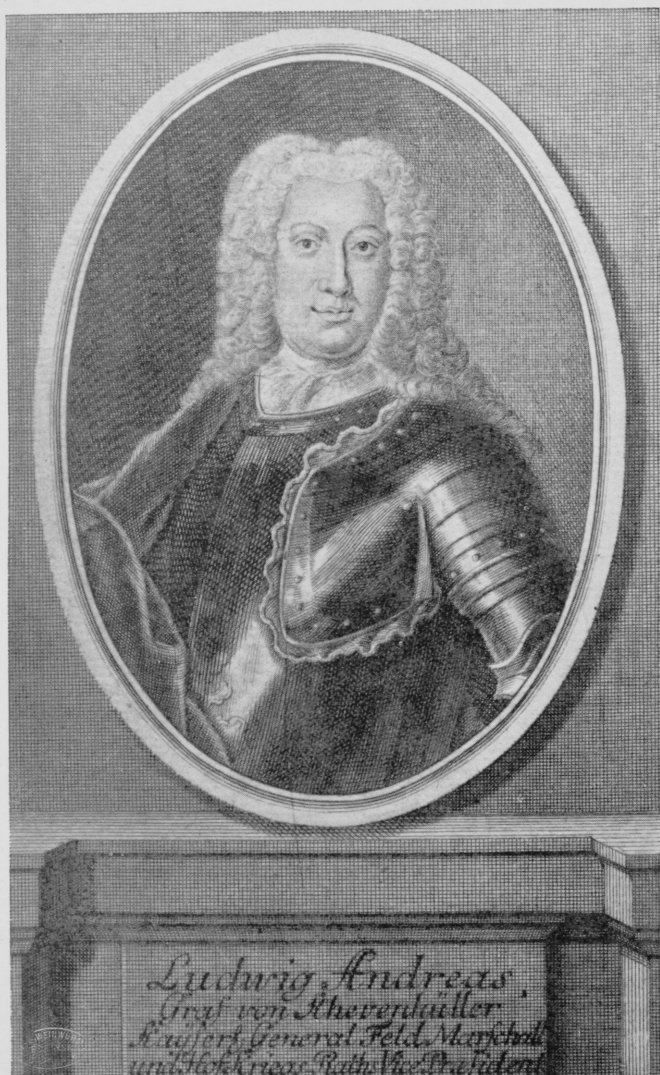
KHEVENHÜLLER LAJOS ANDRÁS GRÓF TÁBORNOK. A történelmi arcképesarnokban levő eredeti rézmetszet után.