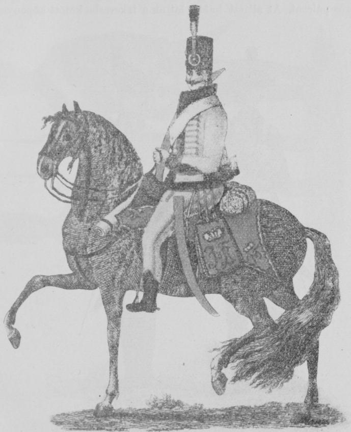
Huszár a francia háborúk idejéből.