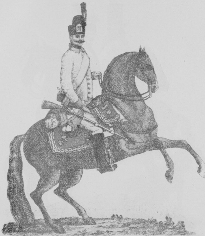
Cheveaux-leger, Mária Terézia korából.

Az egyéb fegyvernembeliek közül már a XVIII-ik század hetvenes éveitől kezdve alakul ki a tüzérség egyenruházata. A legénység fővege fekete posztó-nemezsből készült alacsony magyaros pörge kalap féle, körül sárga zsinórral szegve, a melynek azonban karimája hátul