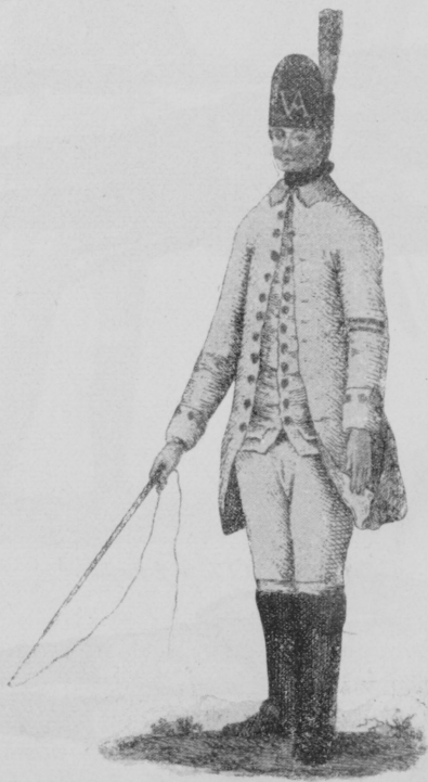
Szekeresz a XVIII-ik században.

Összes fegyvernembeli tisztjeink e korban, teljesen francia módra öltözködnek háromszögletű kalappal. Jelvényük a pálcza, fegyverük a vékony spádé s a gyalogsági tisztek díszfegyvere az alabárd-serű partisane.