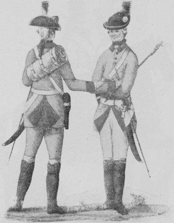
Tüzéreink a XVIII. században.

fekete bőrhüvelybe bujtatott nyitott kézvédős kurta szablyát, jobboldalukon pedig a mellen keresztül vetett fehér szíjon lógó fekete bőrtokban pisztolyt hordanak. A kard mellé dugva viselik a gyújtó-zsinóros-pálczát. Az altiszt hátán látjuk a tekeresbe kötött köpenyeget.