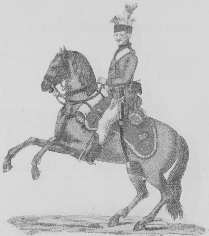
Uhánus II. József korából.