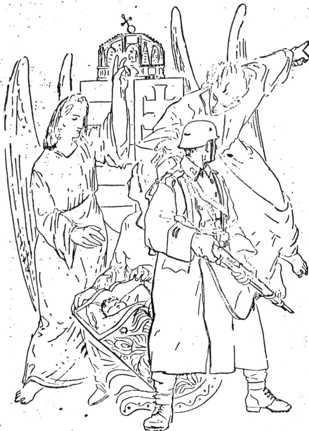
(Szalay Lajos rajza)

Az ellenség megint ugyanaz az ázsiai romboló düh, mely hajdanában a tatárjárás, majd a török hódoltság alakjában pusztított végig Magyarországon. De a történelem folyamán most történik első ízben, hogy a nemzet nem magára hagyottan viaskodik az óriás túlerővel, hanem hatalmas és dicsőséges szövetségesek oldalán vonul hadba. Büszke és boldogító gondolat, hogy a magyar csapatok harci erényekben méltó és egyenrangú bajtársai a világ első katonáinak, a német hadseregnek. A magyar katona nemcsak bátor, fegyelmezett és áldozatkész, hanem — mint egy ősi, harcias nép fia — nagy