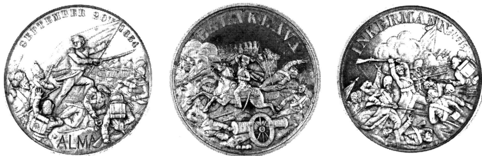
A krími háború csatáinak brit emlékérméi