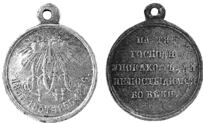
Orosz „Az 1853-1856. évi háború emlékére” Érem elő- és hátlapja

A 14. sz. alatt ismertetett érem bronz változata. Sárgarézben és bronzon kívül – miniatűr változatát – aranyból is készítették. 68