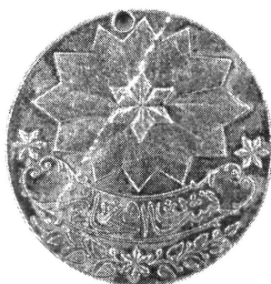
A török Dicsőség Rend Érdemérme

A tárgy 1969-ben vétel útján került az Országos Hadtörténeti Múzeumba 80 forintért.