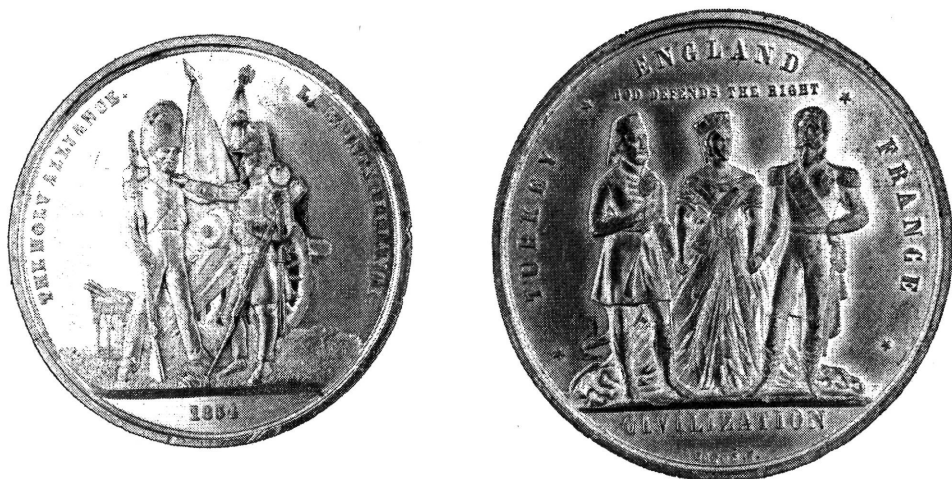
A brit-francia és a brit-francia-török szövetség emlékérméi

felirat, a szelvényben évszám: 1854. A szelvény felső, döntött peremén PUNCH D. és ALLEN & MOORE F. jelzés olvasható.