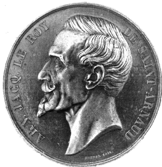
Armand Jacques Leroy de Saint Arnaud marsall emlékérem

Hátlap: NÉ A PARIS LE XX AOÛT M. DCC. XCVIII. MORT EN MER LE XXIX SEPTEMBRE M. DCCC. LIV. köriratban babérkoszorú, benné a marsall életpályájának állomásai nyolc sorban: MINISTRE DE LA GUERRE / MARÉCHAL DE FRANCE / SÉNATEUR / GRAND-ÉCUYER / COMM E EN CHEF L'ARMÉE D'ORIENT / DAHRA-KABYLIE / DÉBARQUEMENT EN CRIMÉE / ALMA. A sorok mellett tussal írott 25 135 szám olvasható.