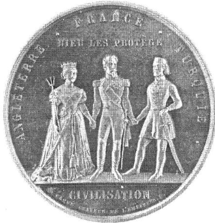
A török–brit–francia szövetség emlékérmé

A francia kiadású érmet a 4. tétel alatt található bronzérem angol változata. Bár attól mind méretében, mind anyagában eltér, s az előlap alakjai is más sorrendben állnak, a