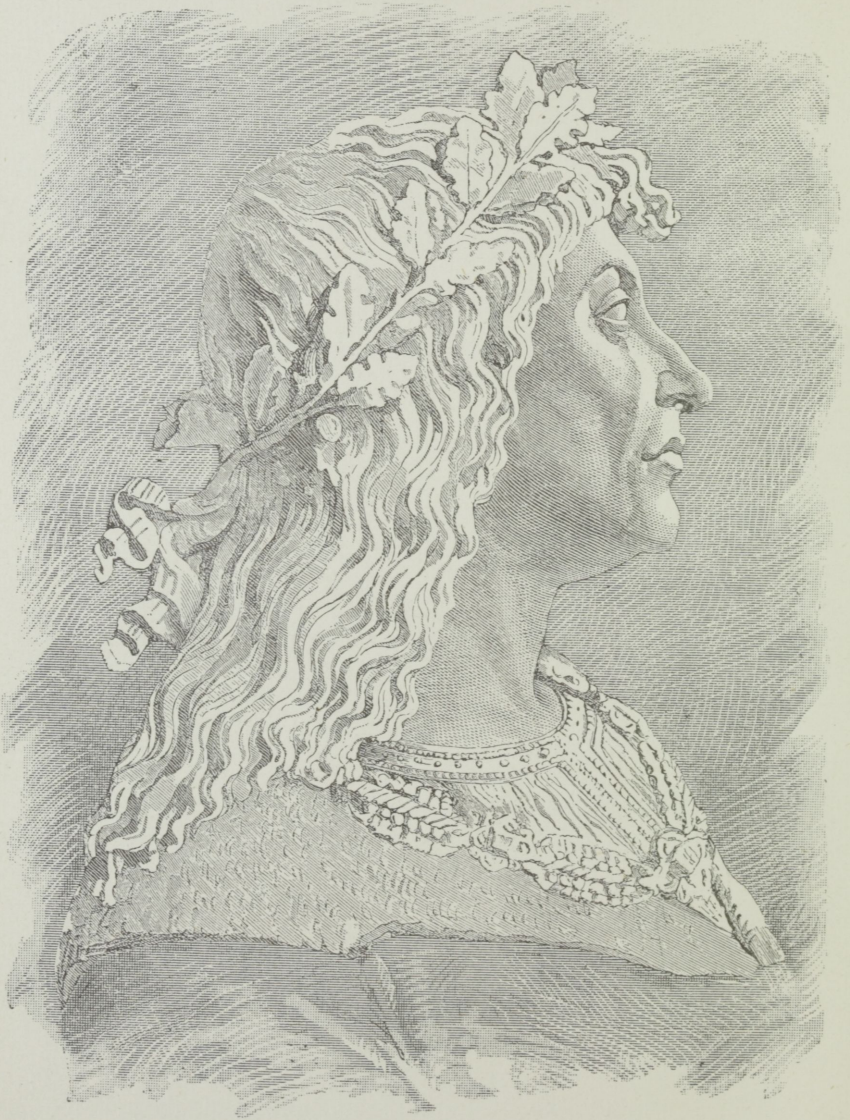
CORVIN MÁTYÁS, MAGYARORSZÁG KIRÁLYA.