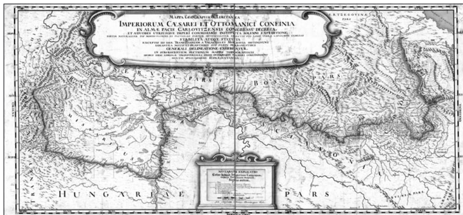
1. melléklet. Az áttekintő térképszelvény

Az áttekintő szelvény fekvő téglalap alakú, mérete 48,5×105,5 cm. Kerete kettős: a külső kereten a földrajzi koordináták láthatók, a belső keret maga a térképtükör, mérete: 47,5×103,5cm. A kereten kívül található az égtájak megírása, fenn Meridies = dél, jobboldalt Occidens = nyugat, lent Septentrio = észak, baloldalt Oriens = kelet. A mai ember számára érdekes, hogy az áttekintő szelvény jobb felső sarkában található az Adriai-tenger, bal oldalt lent pedig Csongrád és Gyula városa.