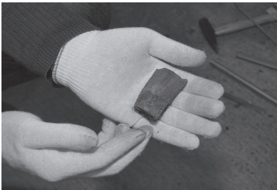
3. A bombatestet lezáró fadugó