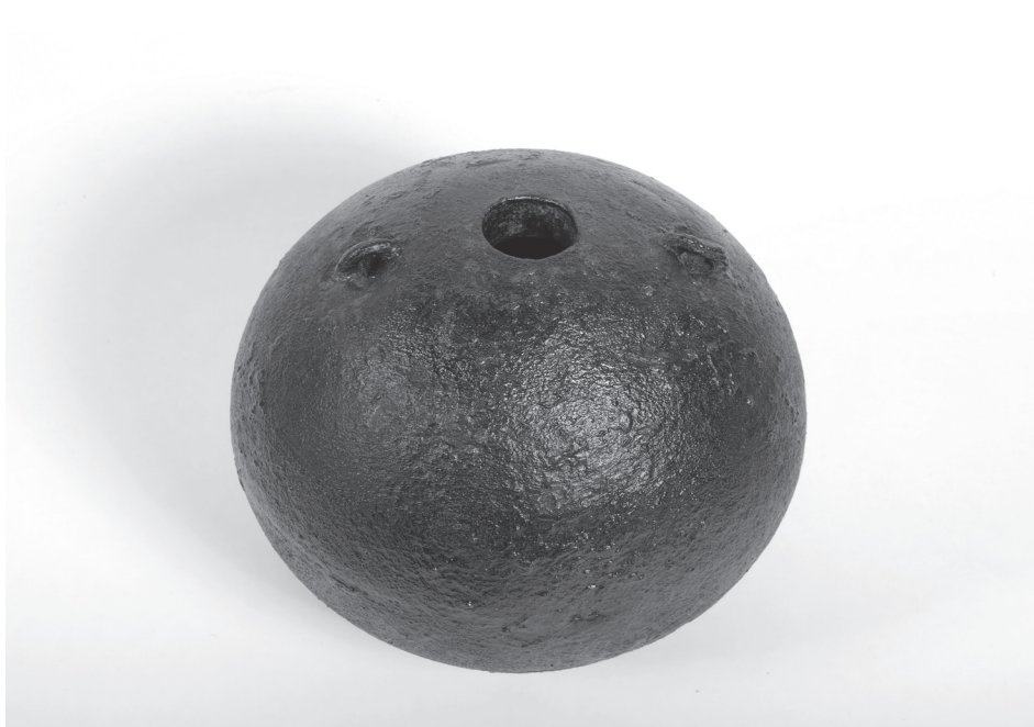
2. 2011-ben a Dunában talált mozsárbomba a restaurálás után