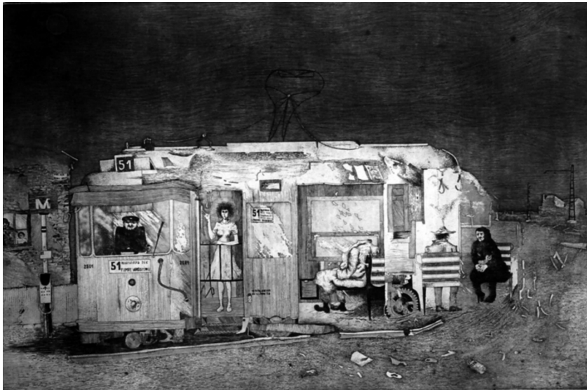
Muzsnay Ákos: Utolsó villamos