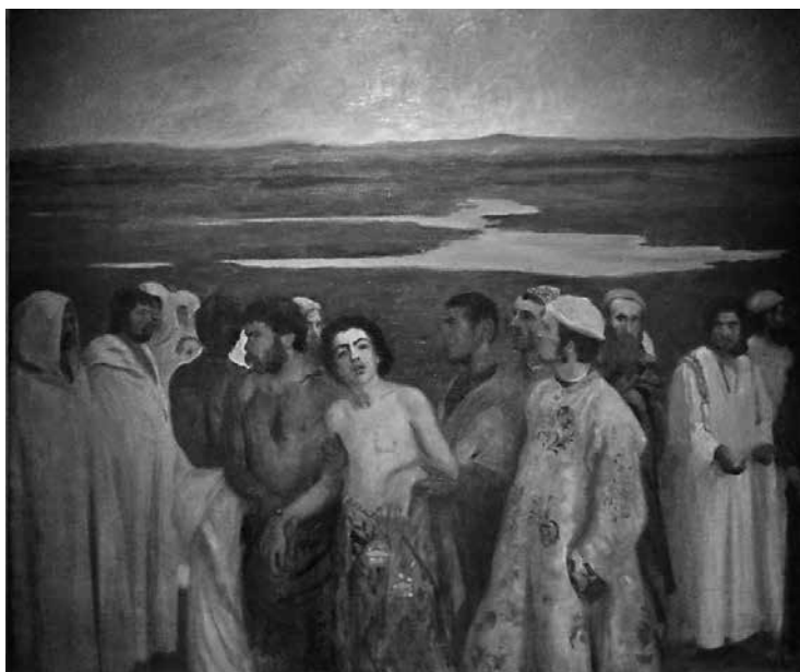
Ferenczy Károly: Józsefet eladják testvérei, 1900.

A társadalmi intézményesség dominanciája nagyon fontos tudománytörténeti lépésként értelmezendő: ennek révén vált kiiktathatóvá a magyar művészettörténetet oly sokáig meghatározó dichotómia: a magyarországinak és a magyarnak szembeállítás. A magyarországi társadalom intézményes elvárásainak szempontjából ugyanis minden , ami ezen intézmény-