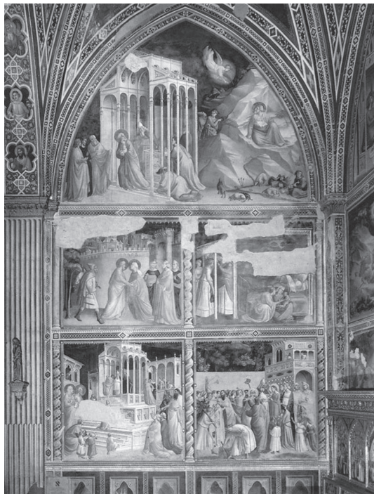
Baroncelli-kápolna Taddeo Gaddi freskói S. Croce, Firenze

mánya zárja. Írását, hasonlóan a könyv többi fejezetéhez, magas színvonalú, világos és informatív gondolatmenet jellemzi. Az angol–magyar párhuzamos szöveggel megjelentetett könyv gazdag anyagot fed le, akár két kötetre elegendőt is. A biztos szakmai tudás, az alapos végjegyzetek, a gazdag illusztrációk és az egyes kiállított tárgyak szakirodalmát koncentráltan feldolgozó katalógus sok szakértőt vonz majd. Az érdeklődő olvasó hálás lesz a zsargonától és hermetikusan utalásoktól mentes nyelvtől, amely sokszor terhelő a képelméleti munkákat. A diákok gazdagodnak majd az egyes témák alapos feldolgozásaiból és a szakkifejezések magyarázataiból. Számomra remek egyetemi oktatási anyagnak bizonyult ez a kötet. Segíti elosztatni a ködöt, amely megüli az elmét, amikor olyan tudósok szövegeivel szembesül, akik túlságosan sokat tudnak a középkori művészet túlságosan sok kérdéséről. □