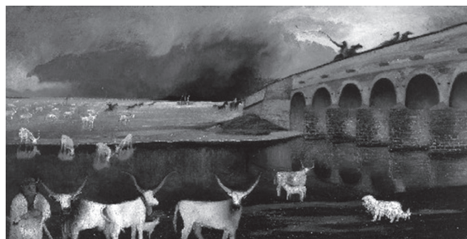
Vihar a Hortobágyon, 1903

koholmánya. Gulyás Gábor a már Lehel Ferenc által is feltupírozott elbeszélést további tódtításokkal egészíti ki: nála a müncheni képtárban történekről Kosztká egy meg nem nevezett diáktársa tudósít, és azt is határozottan állítja, hogy az elkészült kép Böcklin egyik kiállított rajza elé került, és a két alkotást hosszasan összehasonlította a művész. A Lehel által idézett, hiteles, más szövegvariánsokkal 40 is megerősíthető Csontváry-beszámoló is átalakul. Amíg a Kosztká-