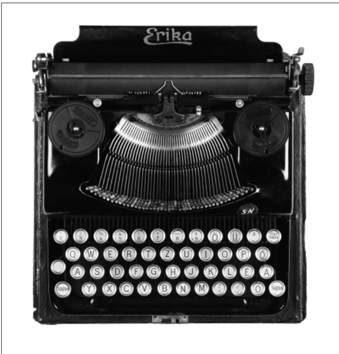
ESTERHÁZY MARCELL – JCE, MAGYARORSZÁG, HERMES & ERIKA (2012) 55x35 CM, GICLÉE PRINT

ARTE ■ A náci megszállók és magyar cinkosaik bűntettei után újabb terror kerítette hatalmába Magyarországot, amelyet az egypártrendszer kényszerített rá. Ez a terror, lecsillapodott formában, a nyolcvanas évek végéig dübörgött. Az egész társadalmat szigorúan megfigyelték, nyilvántartották. Az ÁVH, a magyar titkosszolgálat óriási kém- és besúgóhálózatot állított fel. Senki sem bújhatott ki az ellenőrzése alól.