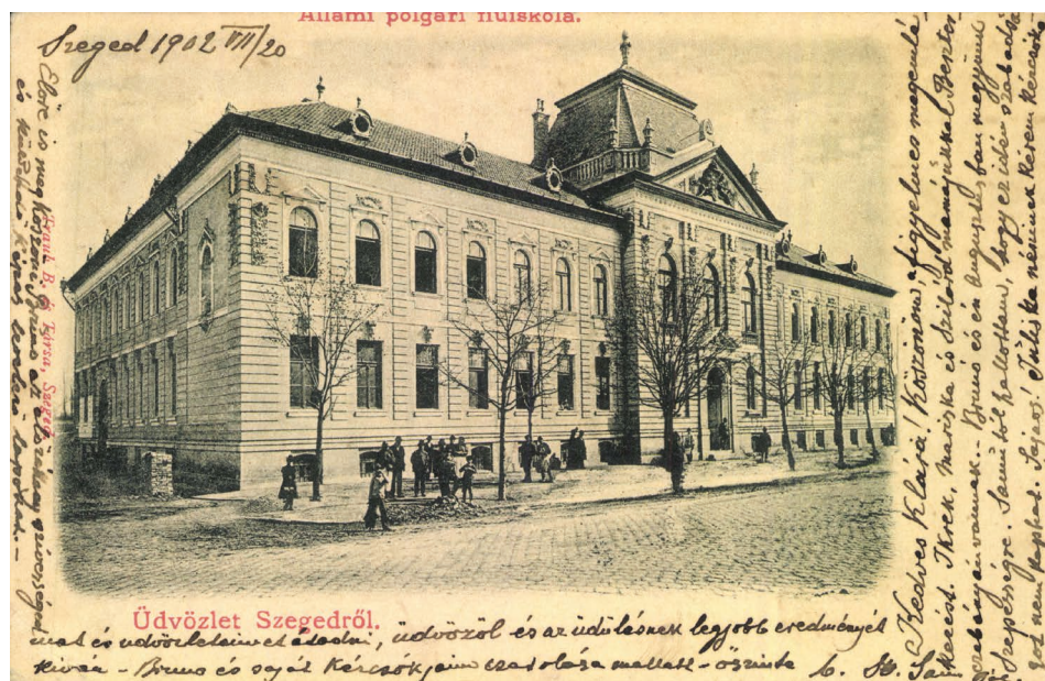
2. kép. A III. kerületi polgári fiúiskola, ma az SZTE Juhász Gyula Pedagógusképző Kar főépülete 6

Az első polgári iskolát 1899-ben államosították, és az 1885-ben az iskola mellett szervezett közép kereskedelmi iskolával együtt a Tisza-partján felépített szép épületbe költözött. A megnövekedett tanulói létszám miatt 1911-ben újra költözni kényszerültek, ezúttal a Madách utcába. A Tisza-parti épület ma a Körösy József Közgazdasági Technikum, az új székhely pedig a Madách Imre Két Tanítási Nyelvű Általános Iskola épülete.