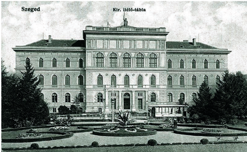
1. kép. A Főreáltanoda, majd a kir. Ítélőtábla épülete, 1921-től az egyetem főépülete 4

A négy utcára tekintő hatalmas kétemeletes épületben már 1873-ban megkezdődött az oktatás. 1883–1894 között a Somogyi Könyvtár épülete is volt, majd 1894-től a királyi ítélőtábla működött a falai között. 1921-től a szegedi egyetem központi épülete lett, és az ma is (Blazovich, 2005. 85–127.; Kovács és Vida, 2016).