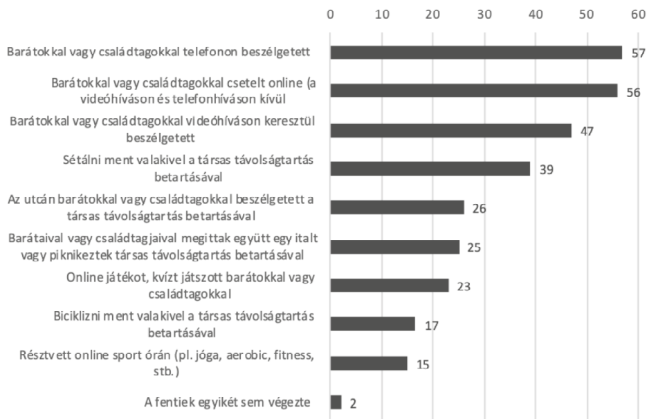
3. ábra. Szabadidőben végzett tevékenységek megoszlása a lekérdezés előtti héten (%) (N = 2 860)

A hallgatók szubjektív megítélése szerint a korlátozások bevezetése óta a családtagjaikkal többet, viszont a barátaikkal kevesebbet beszélgetnek (12. táblázat). A válaszadók 86%-a arról számolt be, hogy van legalább egy olyan személy, akivel meg tudja beszélni a bizalmas, legszemélyesebb magánügyeit is.