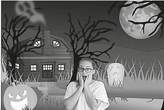
3. kép. Green screen technológiával készült digitális fotó. 9. évfolyam, csoportmunka. Eötvös Gyakorlóiskola, Nyíregyháza

A green screen technológiát csoportmunkában ismerhették meg a diákok behatóan, vagyis zöld háttér előtt készítettek olyan beállításokat, melyeknek később a háttérét lecserélhették egy tetszőleges képre. Voltak olyan csoportok, akik kifejezetten egy háttérhez „póztak”, a telefonos alkalmazás ugyanis utólag illesztette a választott képet a zöld felületre, így pontosan meg kellett határozni, hogy mi hol foglaljon helyet a kép terében. Többféle alkotói koncepció jelent meg a feladat kapcsán, többféle képi megoldást magában hordozva.