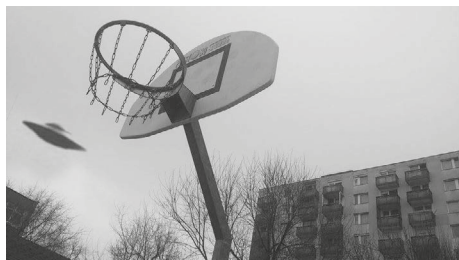
5. kép. Dupla expozícióval, filterekkel, montírozással készült fotó. 9. évfolyamos lány alkotása. Eötvös Gyakorlóiskola, Nyíregyháza

Műfaji megkötés a feladatoknál nem volt, a megadott képmódosító technikát kellett egyes tanórákon alkalmazni a tanulóknak. Hogy milyen irányba indultak el, azt személyes élményeik, a filmes hatások, a bennük munkáló gondolatok határozták meg. Természetesen érdemes a tanórák előtt közösen gondolkodni a diákokkal, ötleteket adni, elképzeléseikre akár vizuálisan reagálni, hogy a kortárs művészetből ihletet tudjanak meríteni. Nem minden ötlet és terv lett sikeres, de a rengeteg variációs lehetőségnek köszönhetően minden tanuló eredményesen oldotta meg a feladatokat ezeken az élményközpontú tanórákon. Az összetett vizuális közlések tantervi témakörébe illeszkedő tanórák, melyek a képi manipulációt mutatták be, hatékonyan segítették a fiatalokat a képpel megjelenített valóság megértésében és értékelésében.