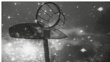
4. kép. Montírozással készült digitális fotó. 9. évfolyamos lány alkotása. Eötvös Gyakorlóiskola, Nyíregyháza