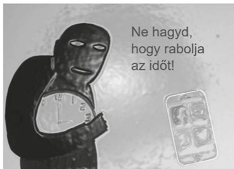
6. kép. Manuális és digitális eszközökkel készített médiaüzenet variációi. 10. évfolyamos fiú alkotása. Eötvös Gyakorlóiskola, Nyíregyháza