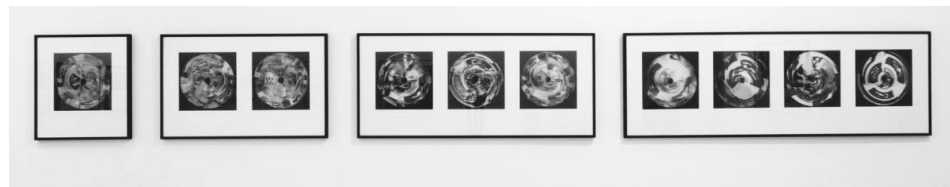
1. kép. Szegedy-Maszák Zoltán: Tárgyak. 2015. Multimédia mű. Ludwig Múzeum, Budapest

A digitális kreativitás az alkotói körbe vonja a nézőt is, akinek módja van befolyásolni egy interaktív installáció képelemének megjelenését, módosítva a színeket, a formák alakját és méretét, a mozgások sebességét és irányát (Dreher, 2012; Hope és Ryan, 2014). A művész által felkínált vizuális eszközkészletben az amatőr „társ-alkotó” biztonságos közegben mozog: a mű itt a jelkészlet és a komponálási lehetőségek halmaza. Az interaktív mű átgondolt rendszer, amelyben egy-egy alkotóelemet átalakítva átélhetjük a digitális kreativitást. „A több, interaktív és szimultán módosuló képfelület előhívói (a használók) eddig ismeretlen képforma alkotói és érzékelői lesznek. Bár nincs ártatlan vagy érintetlen szem, az új képi jelenségek feldolgozásához, a vizualitás forradalmának megtapasztalásához kíváncsiságra és érzékenységre, de leginkább aktív látásra van szükségünk.” (Dékei, 2007. o. n.)