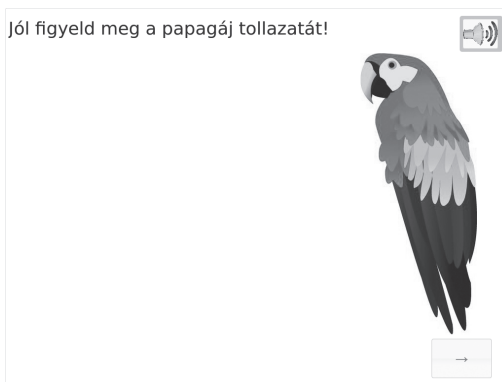
3. ábra. Színmemóriát mérő feladat [Utasítás: Jól figyelj meg a papagáj tollazatát! Illeszd a papagáj tollait színek szerinti sorrendbe a felületeken úgy, ahogyan az előző képen láttad! Tantervi kapcsolódás: események felidézése látott vagy elképzelt történetek színes technikákkal.]