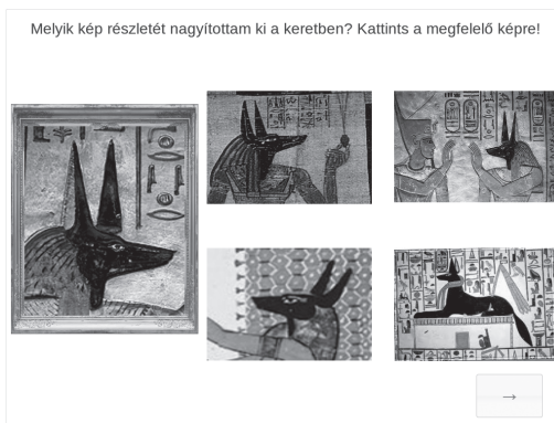
2. ábra. Szín- és formafelismerést mérő mintafeladat [Utasítás: Melyik kép részletét nagyítottam ki? Kattints a megfelelő képre!; Tantervi kapcsolódás: szinkontrasztok felismerése, értelmező-elemzői képességek (Kerettanterv, 2012, 1-2. évfolyam)]