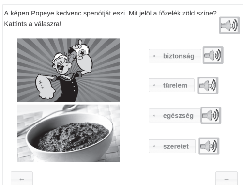
4. ábra. Színjelentést mérő feladat [Utasítás: A képen Popeye kedvenc spenótját eszi. Mit jelöl a főzelék zöld színe? Kattints a válaszra! Tantervi kapcsolódás: színek tudatos használata (Kerettanterv, 2012, 3-4. évfolyam).]