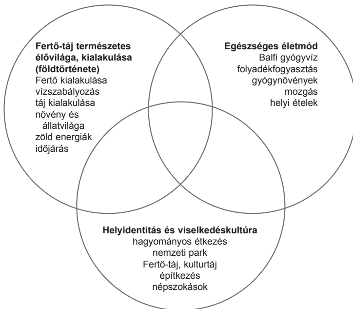
1. ábra. A Fertő-táj a határ mentén projekt modulegységei

2016 szeptemberében Fertődön, a Soproni Szakképzési Centrum Porpáczy Aladár Szakgimnáziumban a turisztika szakágban kísérleti jelleggel projektoktatásban történt a tananyag oktatása. Az Erdőpedagógia projekt mintájára három modult alkottunk (1. ábra).