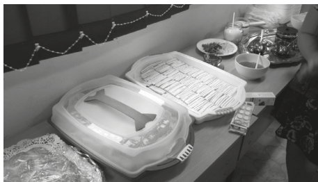
2. kép. A Fertő-táj jellegzetes süteményei