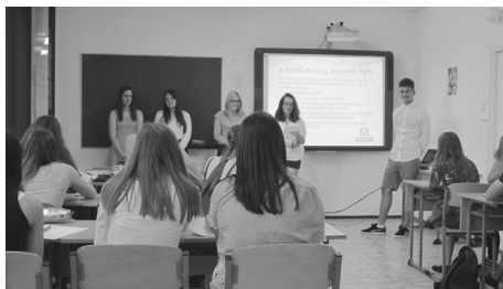
4. kép. Az osztály a Projektnapon