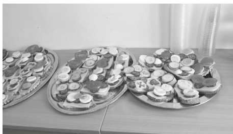
1. kép. Helyi alapanyagokból készített szendvicsek

A csoportok értékelték saját magukat, társaikat és a zsűri is értékelte a feladatokat.