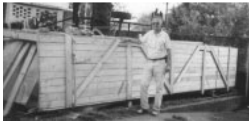
A székelykapu ládában a Hungária udvarán (Archívfoto)

A beszámolóból úgyszintén nem derül ki az AMISZ esetleges állásfoglalása az MVSZ és a három dél-amerikai tagállama (Ar-