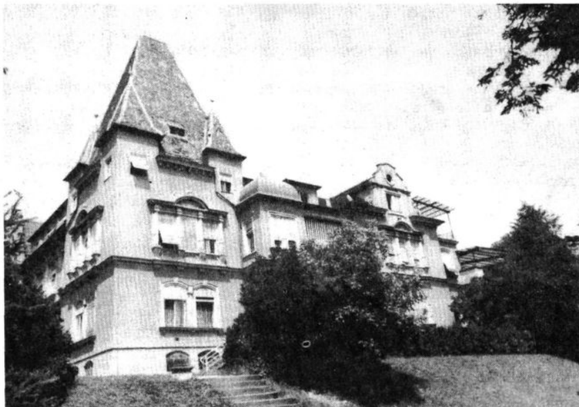
A Városi Csecsemőotthon Grazban – Ady Maria-Grün-i szanatóriuma

Most már így is jó, nem kell, nem lehet.