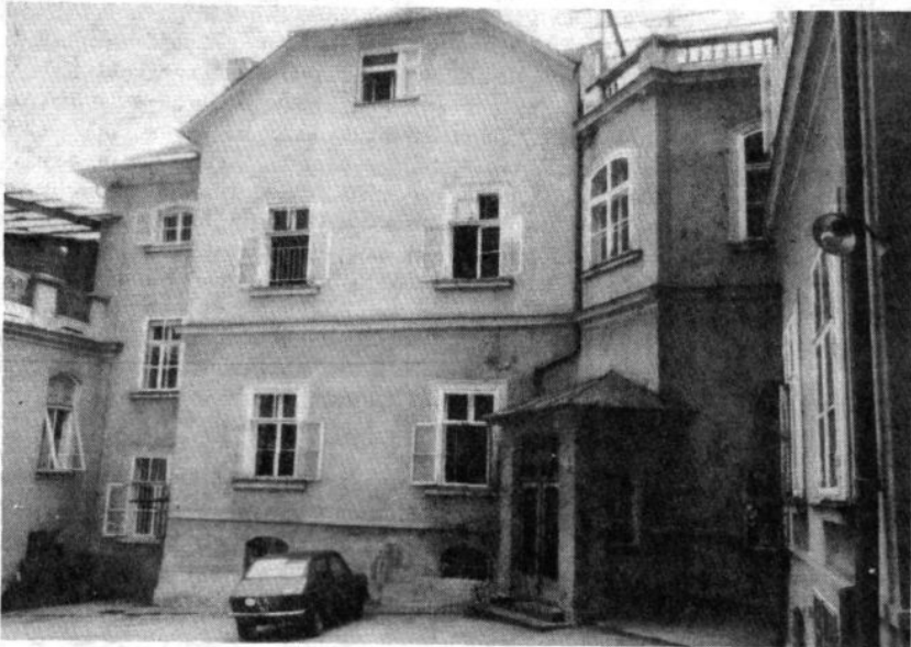
A szanatórium hátsó bejárata